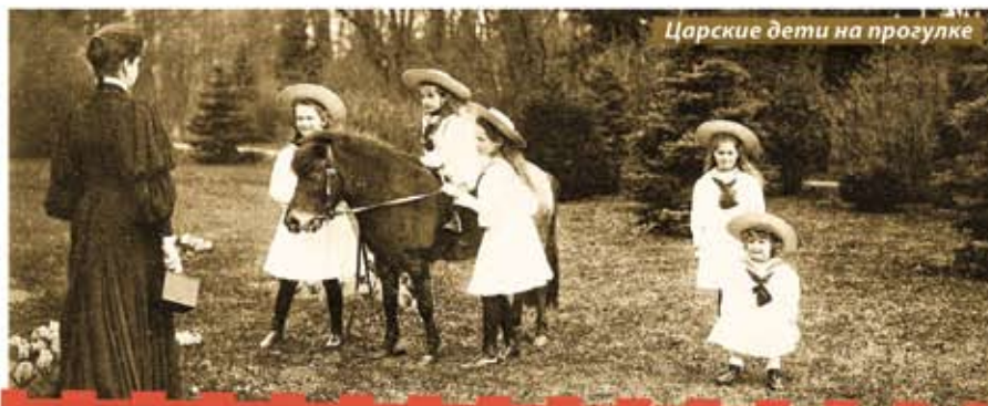
Царские дети на прогулке

За свою чистоту сердца, веру и терпение Ольга, Татьяна, Мария и Анастасия были прославлены Церковью в лике святых. Мы можем молиться им и просить помощи – в учёбе, в дружбе, в семье, в трудные минуты. Они были детьми, и поэтому особенно близки каждому детскому сердцу.