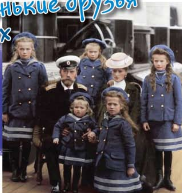
Царская семья на яхте в Крыму

Ребята, когда мы молимся, мы часто обращаемся к святым. Это могут быть апостолы, святители, преподобные – люди, которые жили давно и успели стать взрослыми, многое пережить и многому научиться.