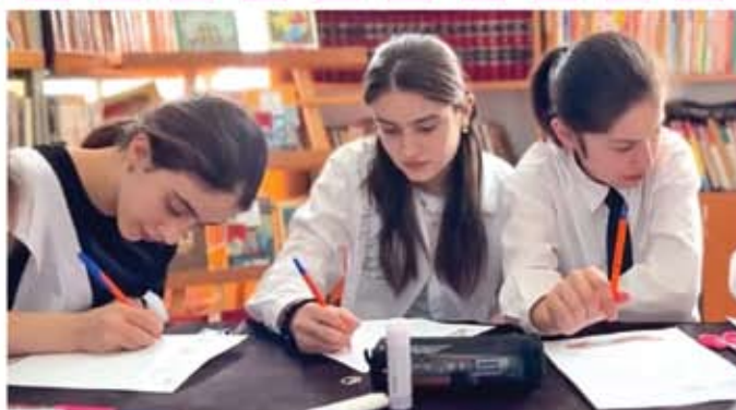
Ученицы школы № 7 г. Рязани пишут письма солдатам