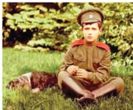
Цесаревич Алексей со своим спаниелем Джоем

Каждое утро у них начиналось с молитвы. Они хорошо знали церковные службы, любили читать духовные книги и старались жить по-христиан-