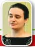
Подготовила Екатерина СИЛИНСКАЯ

Во втором кружочке нарисуй то, от чего ты готов отказаться на время Великого поста.