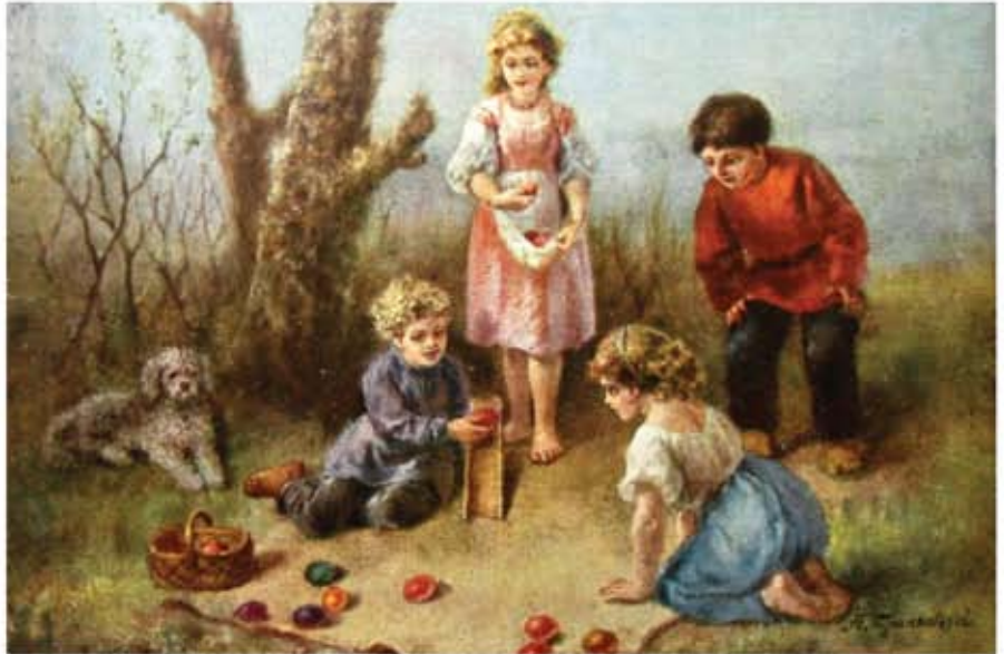
«Катание яиц». Худ. Алексей Транковский

ПЕРВЫЙ ВАРИАНТ. Игрок скатывает крашеное яйцо по наклонной деревянной дощечке или по горке и пытается сбить им другие яйца, стоящие внизу. Если участник добился цели, то берёт сбитое яйцо себе и продолжает игру. Если промахивается, в игру вступает следующий, а не-