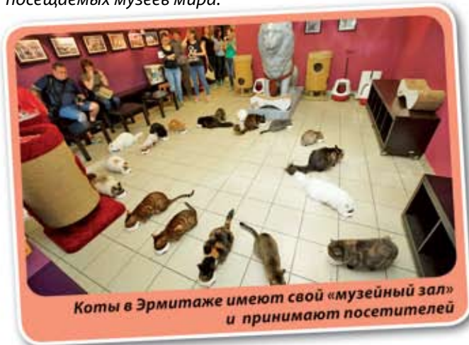
Коты в Эрмитаже имеют свой «музейный зал» и принимают посетителей

Петербурга, расположенный в центре города на Дворцовой площади. В музейный комплекс входят Зимний дворец, где жили русские императоры с семьями, Малый Эрмитаж, Эрмитажный театр, часть Главного штаба и другие здания. Эрмитаж – один из самых крупных и посещаемых музеев мира.