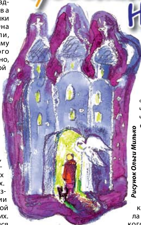
Рисунок Ольги Милько

И вот настала рождественская ночь. Но папа Ани не мог оставить ночью маму одну, и он тихо позвал Аню. Папа сказал ей ласково: «Аннушка, я не могу идти сегодня с тобой в храм, иди одна, а я с мамой останусь». Она очень удивилась: «Как, папа, одной идти? Там страшно и темно!» Папа улыбнулся и ответил: «Иди, помолись Господу Богу за маму. Ангел Хранитель с тобой рядом, он тебя не покинет».