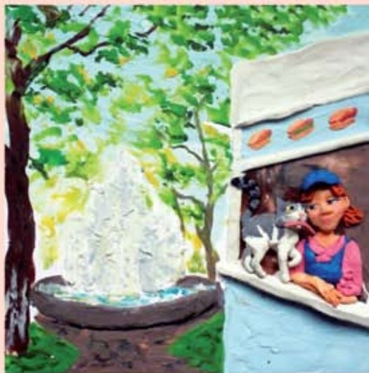
Илл. к книге «Приключения кота Брыся». Брысь и его подруга – продавщица хот-догов Лябочка. Художник Екатерина Зарубина

... Однажды, когда он еще нес караул возле спасенного из огня царского имущества, на место пожара приехал верхом красивый молодой человек. Из-под распахнутого ветром темного плаща виднелся мундир с двумя рядами золоченых пуговиц. Стоявшие в оцеплении гвардейцы вытянулись в струнку и хором поприветствовали: «Здрав... жем... Ваш... ство!» Брысь ничего не понял, кроме того, что персона важная.