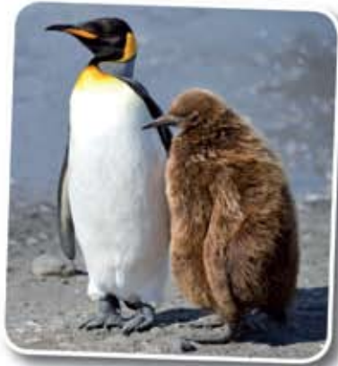
Королевский пингвин с птенцом

– Нет, это же не рыбы, – улыбнулась тётя Люба. – Дышат они мышцами. Да-да, если они прово-