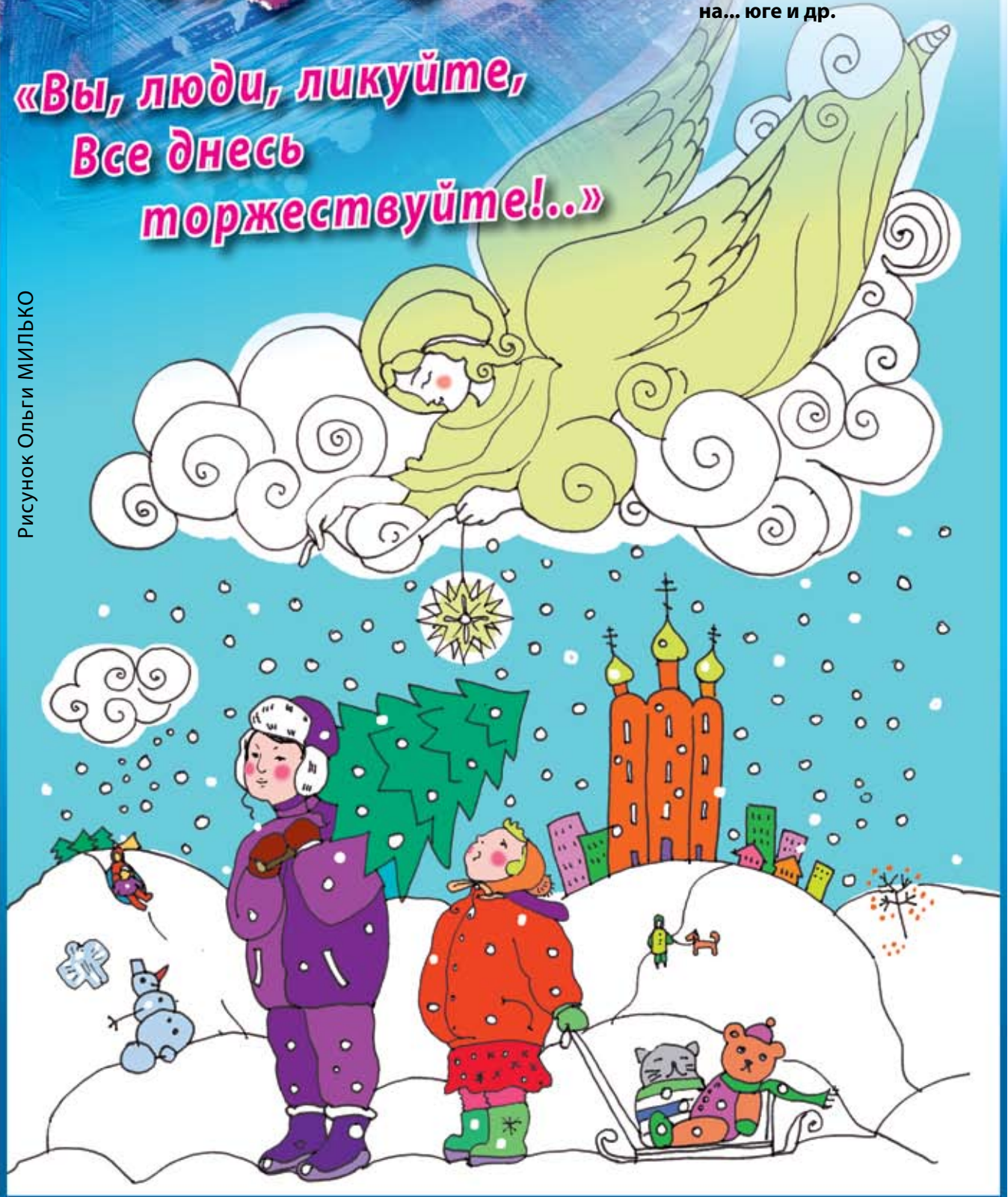
Рисунок Ольги МИЛЬКО

«Вы, люди, ликуйте, Все днесь торжествуйте!..»