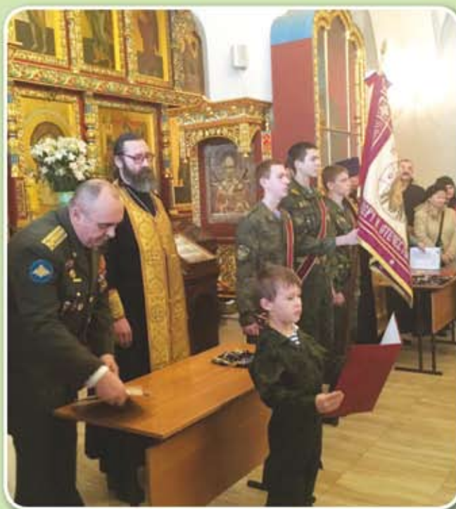
«Православные витязи», принятие присяги