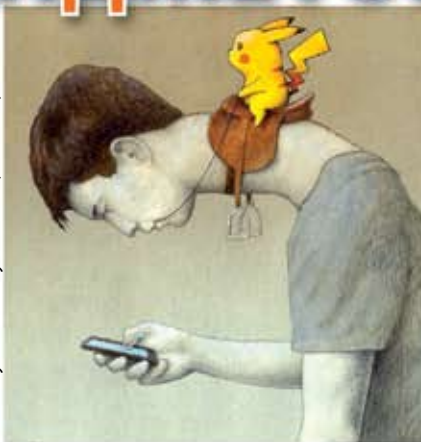
худ. Павел Кучинский (vitrka.ru)

«Все мне позволительно, но не все полезно; все мне позволительно, но ничто не должно обладать мною»