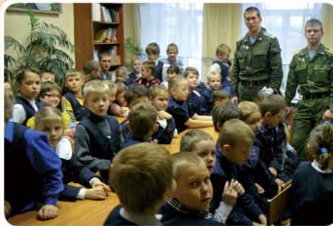
Курсанты-десантники на уроке мужества у касимовских ребят