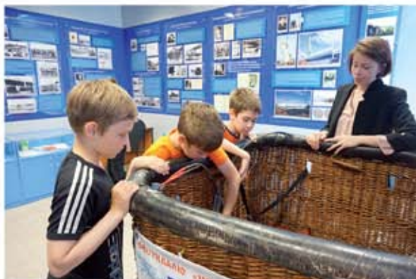
Экскурсия в музее путешественников

Мы приглашаем всех желающих прийти к нам, чтобы узнать много нового и интересного о том большом и прекрасном мире, в котором мы живём.