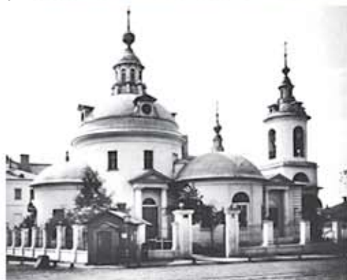
Церковь святых Космы и Дамиана в Москве

известно, что построен он по проекту знаменитого московского архитектора Матвея Фёдоровича Казакова. И точно такой же храм стоит на Маросейке в Москве и называется церковью Космы и Дамиана.