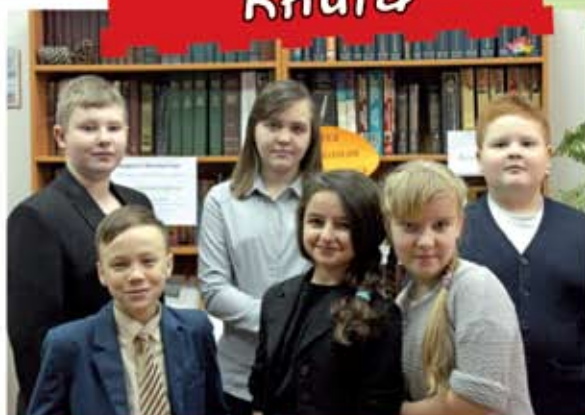
На вопросы «Смайлика» отвечают ученики пятых классов из школы №39.

Я очень люблю читать, меня это вдохновляет на приятные людям поступки. Я очень люблю и советую всем читать бумажные книги. Глаза не болят. Я очень люблю фантастику. Особенно «Гостью из будущего» К. Булычева.