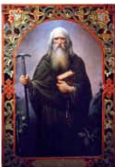
А. Шишкин «Игумен»

Именинами называется день памяти святого, в честь которого назван христианин. После совершения Таинства крещения святой, имя которого выбрано ребенку или крещаемому взрослому, становится его небесным покровителем. Имя выбирается по церковному календарю, каждый день которого посвящен памяти того или иного святого. Если в календаре есть несколько святых с таким именем, то небесным покровителем обычно считается тот святой, день памяти которого ближе других после дня рождения человека (это и будет день его именин). Другие названия этого дня – день Ангела, день тезоименитства.