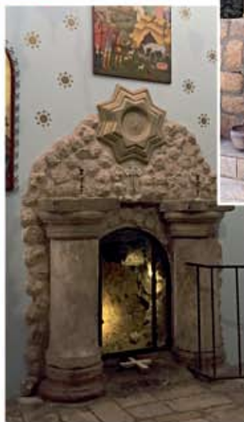
Место погребения Христовых Пастырей в храме Георгия Победоносца

дыхали пастухи, устроен подземный храм Георгия Победоносца. Интересно, что там, по преданию, были и похоронены те самые пастухи. В западной части пещерной церкви есть место, обозначенное белым крестом, – место погребения Христовых Пастырей. А на лужайке возле храма можно встретите фигурки овечек и мозаику с их изображением. Такое интересное место есть на Святой Земле!