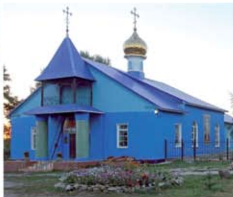
Архангельский храм с. Чернава