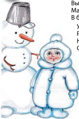
Рисунок Ирины Чечевой