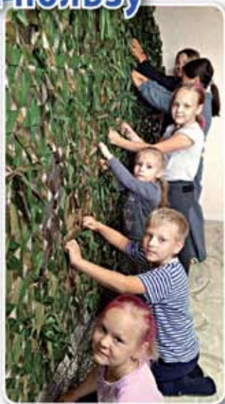
Плетём с радостью!

В нашем храме с самого начала СВО были установлены рамки для плетения маскировочных сетей. Оказываются, такие сети очень востребованы и нужны нашим ребятам, находящимся сейчас на защите нашей Родины!