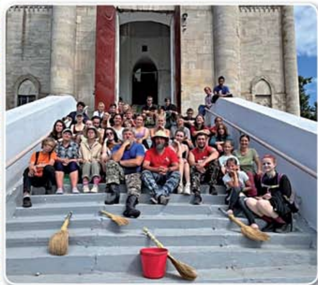
Работаем в храме посёлка Гусь-Железный