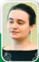
Подготовила Екатерина СИЛИНСКАЯ

У пятой заповеди есть отличительная особенность – это единственная из всех десяти заповедей Закона Божьего, за исполнение которой обещается не только Царство Небесное, но и долгая счастливая жизнь уже здесь, на земле. Вот как Господь о нас заботится, даёт нам любящих родителей и родственников, да ещё и обещает нам счастье, если мы будем любить и почитать их в ответ.