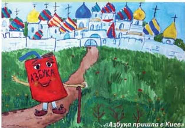
«Азбука пришла в Киев»