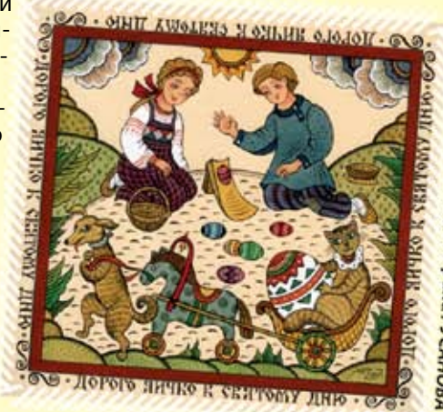
Пасхальный кубок. Худ. Марина РУСАНОВА

Хорошо нам вместе, И обед наш весел! – Христос Воскресе! – Воистину Воскресе!