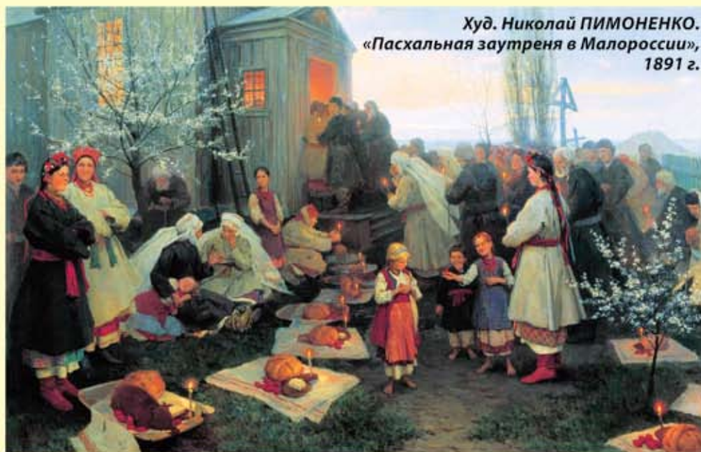
Худ. Николай ПИМОНЕНКО. «Пасхальная заутреня в Малороссии», 1891 г.

Кулич – это как бы наш домашний праздничный артос. Наличие его на столе говорит о присутствии Самого Христа! Моя бабушка и моя мама всегда выпе-