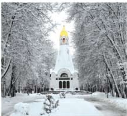
Часовня во имя Всех святых в земле Рязанской просиявших

Небольшое здание, увенчанное крестом, напоминающее своим видом церковь,