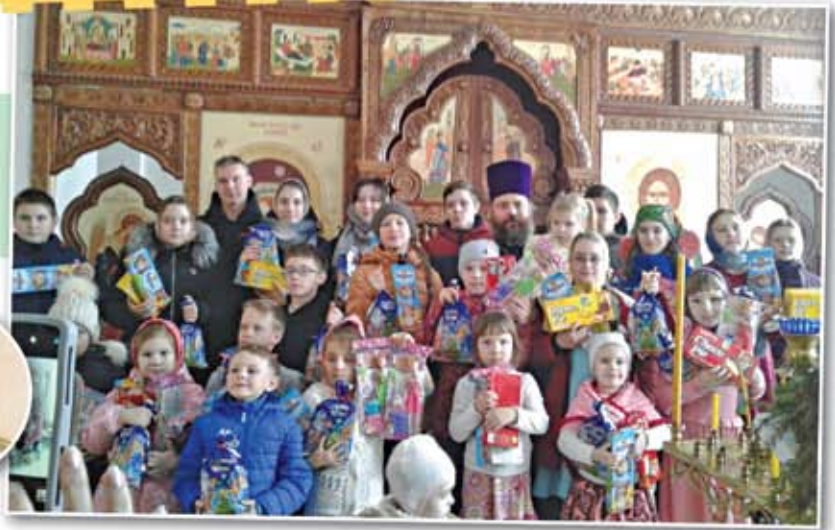
Юные прихожане Никольского храма