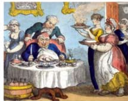
«Чревоугодие». Карикатура XIX века (фрагмент)

Угождение желудка: грех обжорства, чрезмерного пристрастия к сладостям, вкусной пище.