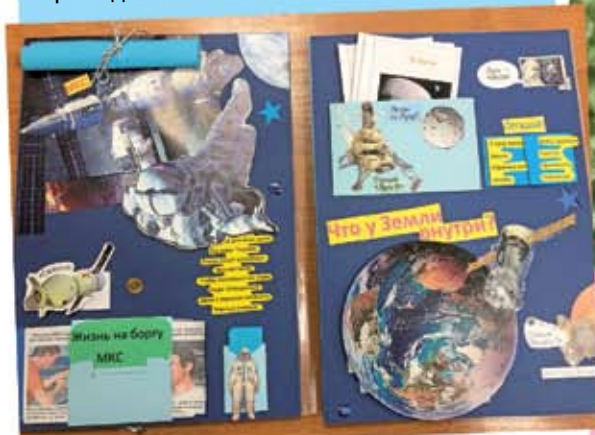
Областной конкурс «Космос становится ближе», первое место в номинации «Лепбук».

3) Городской творческий конкурс «Создаем книгу Даниила Хармса». К каким стихотворениям сделаны эти иллюстрации?