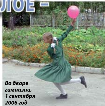
Во дворе гимназии, 1 сентября 2006 год

Мы спокойно в нашем домовом храме читали утреннее правило на церковнославянском языке, пели все вместе «Царю Небесный» и «Достойно есть» перед и после урока. Казалось, что благодаря православным праздникам у нас было больше выходных дней, но на службу прихо-