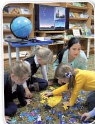
Встреча-путешествие «Космические воскресенья» в мобильном планетарии

собственный литературный фестиваль «Читающая улица Почтовая»; Всероссийская культурная площадка «Ганзеновские чтения»; ежегодные «Митяевские чтения» и собирающие тысячи участников акции «Читаем Анатолия Митяева!»; межрегиональная дискуссия «Безопасный интернет для всех!»; библиотечное Общество книжных первооткрывателей; специальные разнообразные программы для школьников с ограниченными возможностями. А еще наша библиотека – координатор номинации «Юные книголюб» межрегионального конкурса-фестиваля детского литературно-художественного творчества «Начало», организуем «Неделю детской и юношеской книги в Рязанском крае».