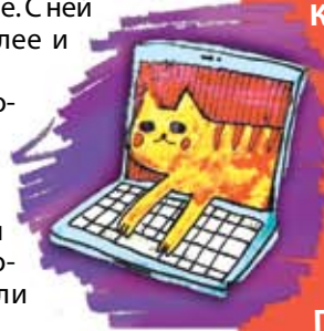
Рисунок Марты ИОГАНСОН

Ирина ШТАКИНА, 5 Б кл. средней школы № 1 г. Скопина Рязанской области