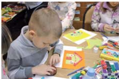
Занятия в воскресном клубе «Остров сокровищ»