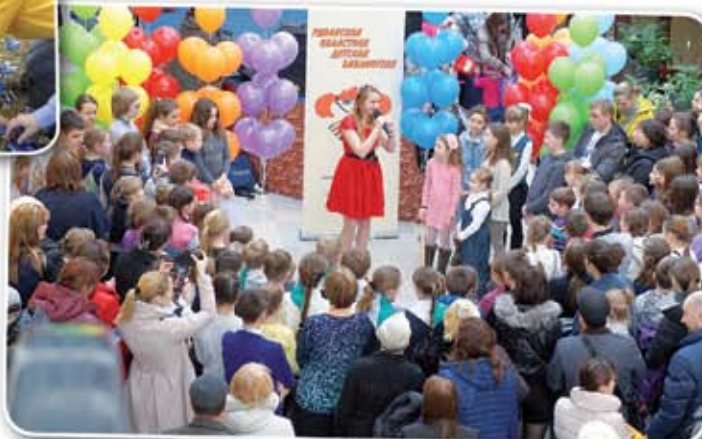
Праздник библиотеки в торговом центре «Малина»