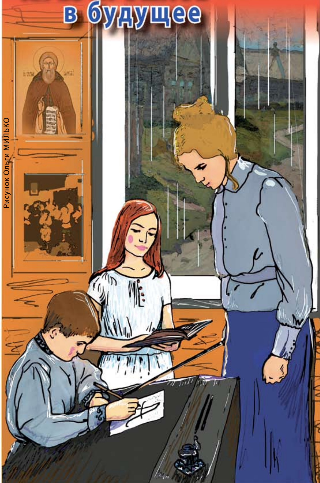
Рисунок Ольги МИЛЬКО