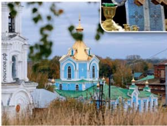
Милостиво-Богородский женский монастырь

Ермишинского района. Его семья была верующей. Мама не разрешала вступать в пионеры, а потом в комсомол. Прадедушка часто вспоминал о том времени, когда закончилась Великая Отечественная война. Горе затронуло каждую семью. Ему было девять лет.