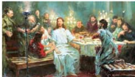
«Тайная вечеря» (фрагмент). Худ. И. Репин

Последняя трапеза Иисуса Христа и двенадцати апостолов, во время которой Христос установил таинство Евхаристии, преломив хлеб и подав своим ученикам чашу с вином со словами: «Сие есть Тело Мое... сие есть Кровь Моя Нового Завета... за