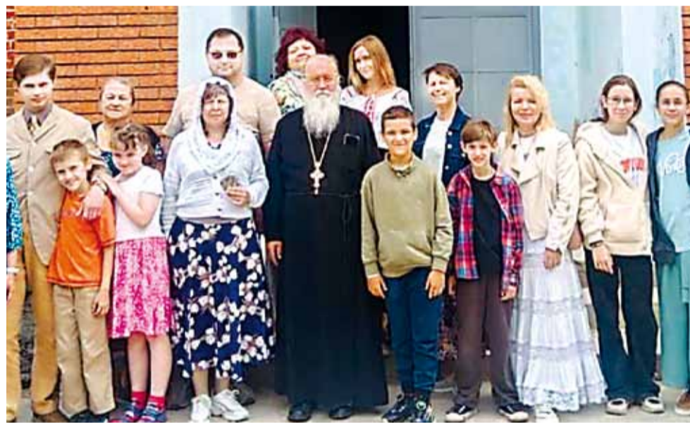
Коллектив творческой мастерской «Зодчий» у храма Воскресения Слоущего

В «Зодчем» детям не читают нравоучений о добре и вере. Они чувствуют добро и принимают веру через делание – через краску на пальцах, стук молотка и усталость в спине после честного труда. Руки их учат лучше слов.