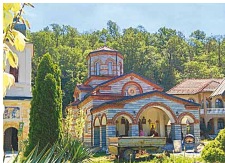
Во Введенском Милькове монастыре