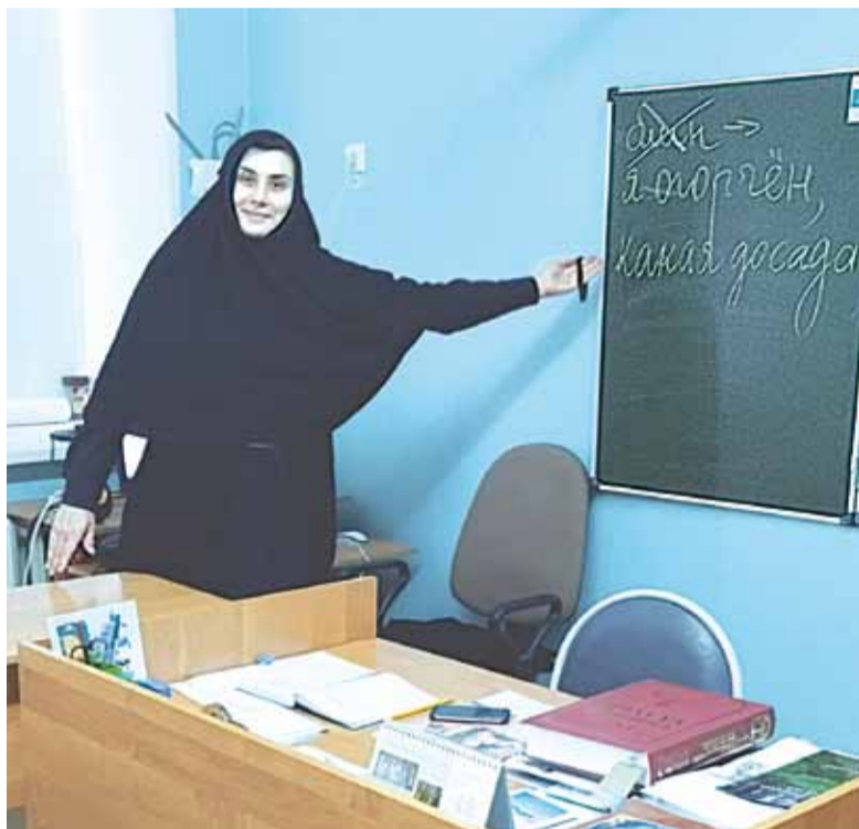
нашей школы для школьников Рязани и области.

Шостье – село удивительное. Небольшое, в рязанской глубинке, на касимовской земле, правильно устроенное: и храм огромный в центре села, Никольский, и монастырь, и средняя школа – огромная, не всякая городская с ней сравнится. И воздух здесь другой – но не от сосен, а от духа русского и сохранённых традиций, от домиков – как положено, с огородами, с живностью. И люди здесь тоже особые – помнящие, чтущие, берегущие и молящиеся.