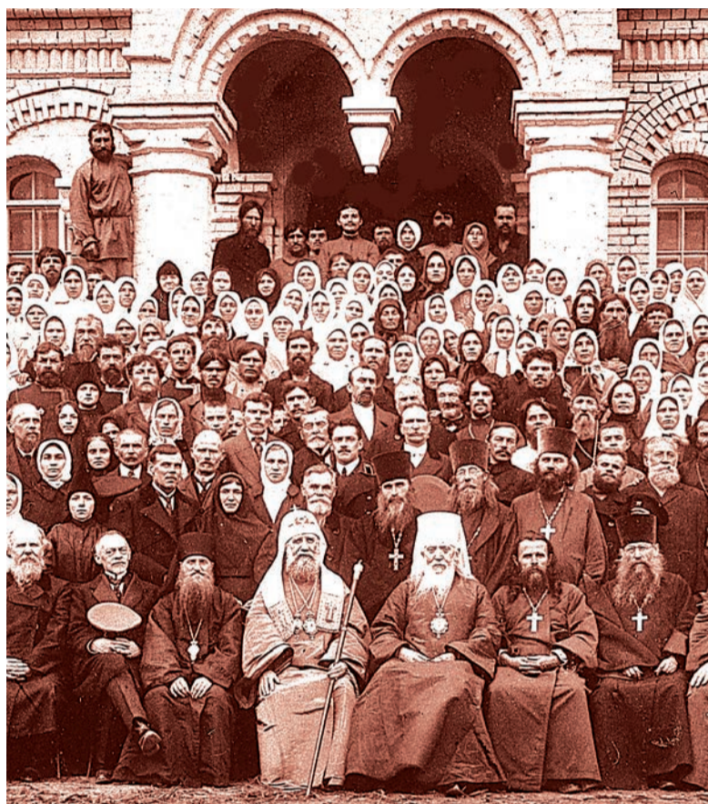
В день освящения Казанского собора 16 сентября 1918 г.

Один из важных этапов его биографии – служение в качестве архиепископа Ярославского и Ростовского. На Ярославской кафедре владыка Тихон пробыл семь лет, с 1907 по 1914 год.