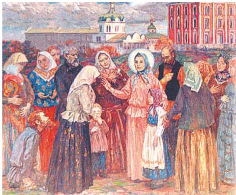
Блаженная Любовь Рязанская. Фрагмент картины В. Ефанова