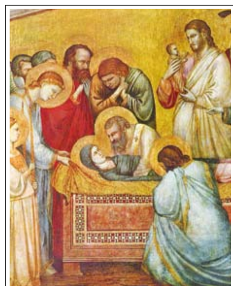
Фрагмент картины Джотто ди Бондоне «Успение Марии», ок. 1310 г.

Любимейшая нами Матерь Божия, наша Заступница Усердная готовится к исходу Своему и вместе с окружающими Ее учениками Христа ожидает и наших молитв. Но не скорбь, а радость была на Ее лице, когда приняла Она весть о Своем приближающемся Успении от Архангела Гавриила. Как описывается в книге «Земная жизнь Пресвятой Богородицы», «лицо Ее сияло такою небесною радостью, что все присутствовавшие были потрясены при виде Божественной силы и славы, осиявших Ее, и все восколебалось от невидимой Божественной силы, окружавшей Ее». Рыдали и горько плакали, узнав о дне Ее кончины и переселения на Небо, любящие Ее ученики Христо-