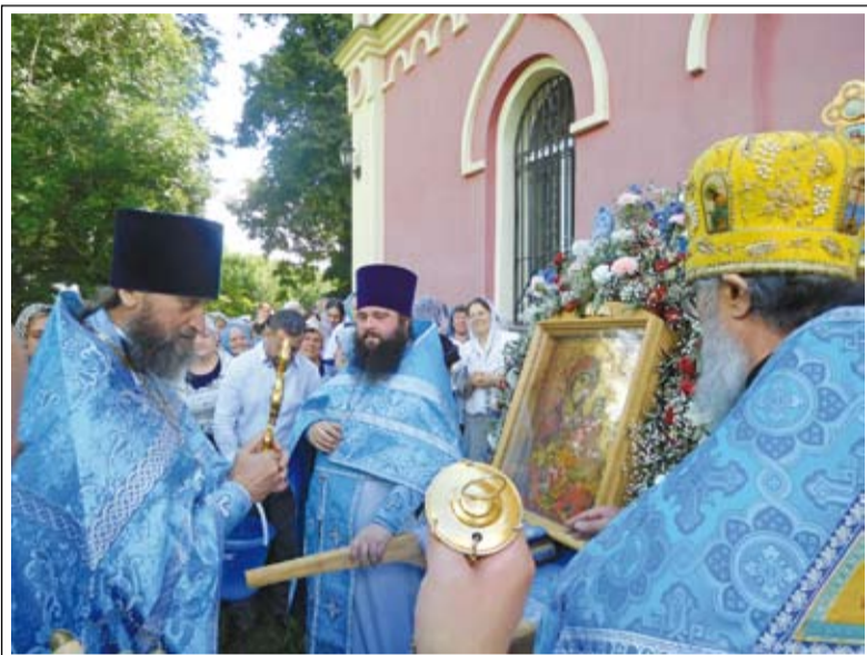
Крестный ход в честь Тихвинской иконы Божией Матери

– Конечно, точь-в-точь скопировать их мы не можем. Брали за основу сюжеты и цветовую гамму. Так как храм в честь Тихвинской иконы, то в росписи храма в основном преобладают сцены из жизни Пресвятой Девы Марии: Рождество Богородицы, Введение во храм, Благовещение, Целование Божией Матери и праведной Елисаветы. Также изображены