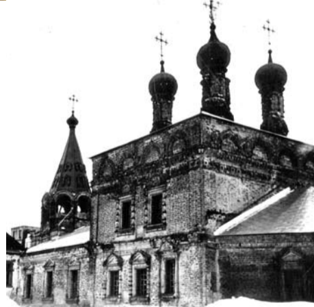
Храм Входа Господня в Иерусалим в 1994 году.