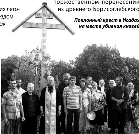
Поклонный крест в Исадах на месте убийства князей