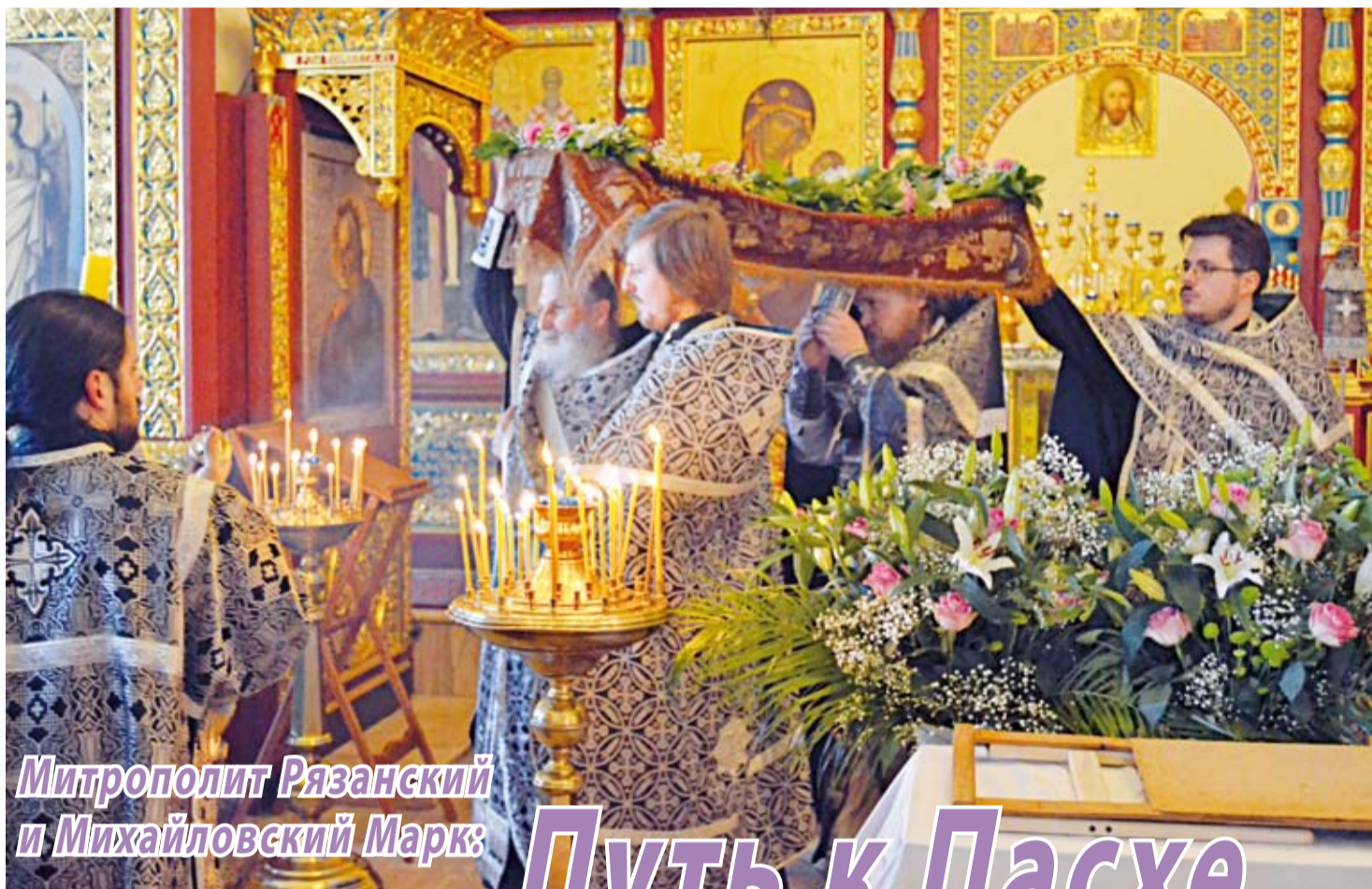
Митрополит Рязанский и Михайловский Марк: