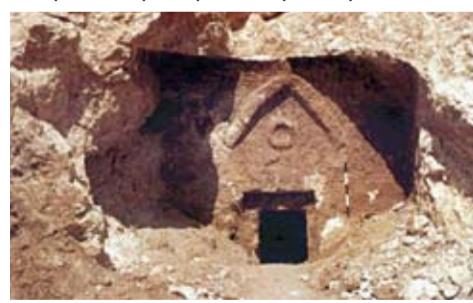
Вход в гробницу в Тальпюте

Однако, все изложенные аргументы – основание непрочное. Предположение о равенстве между именами Мариамна и Мария Магдалина основано на текстах, которые написаны уже намного позже I века и потому не могут быть весомым аргументом. Кроме этого, прочтение имени Мариамна, по мнению многих ученых, крайне сомнительно. Некоторые исследователи вовсе прочли надпись на том оссуарии как «Мариам кар Мара» («кар» – предлог «и»).