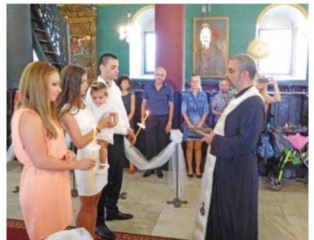
Крещение в храме св. Атанасия, г. Варна