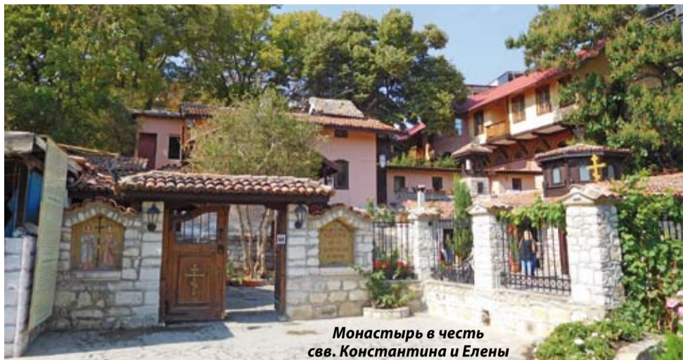
Монастырь в честь свв. Константина и Елены

последовательницам ислама. Эту традицию нынешние православные жительницы стран южной и восточной Европы переняли у своих прабабушек, с немалым мужеством свидетельствовавших о верности Христу». И сама я, каюсь, не всегда надевала платок, входя в болгарский храм, поддаваясь общему настроению.