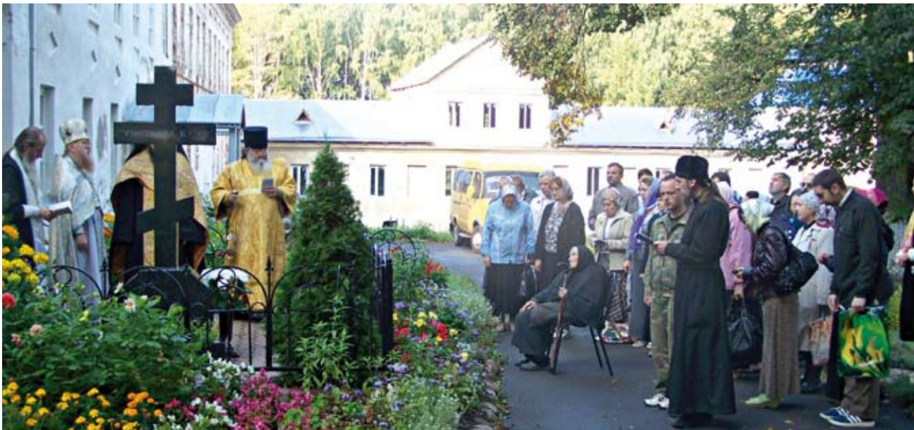
Рязанцы на могиле митрополита Симона в Николо-Бабаевском монастыре, 2011 год

Наталья ГОРДИЕНКО / Фото из архива редакции