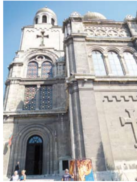
Успенский собор, г. Варна

одного государства совпало с ослаблением в это же время другого. Как заметил академик Дмитрий Лихачёв, крещение болгарского народа в 865 году, «Золотой век» Болгарии и построение «Державы духа» происходило в то время, когда Россия только начинала своё государственное строительство.