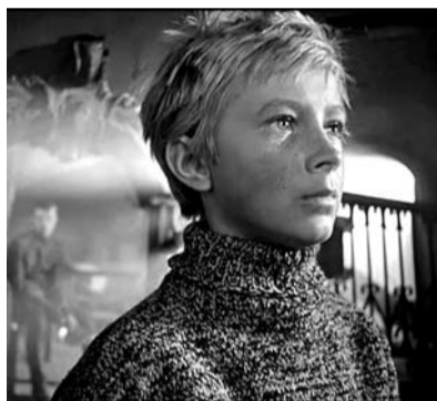
Кадр фильма «Иваново детство»

«Мы с Тарковским о вере не говорили... Он мне просто надел первый крест в жизни»