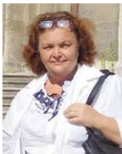
Ирина ЕВСИНА / Фото автора

Ну что ж, в следующий раз, думаю, доберёмся и до Софии – ведь желание вернуться в тёплую и радужную Болгарию осталось.