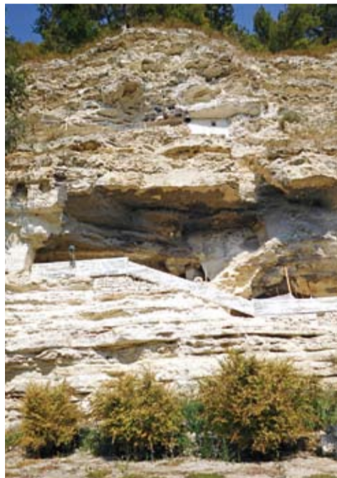
Пещерный монастырь Ажда

Когда мы составляли маршрут, попросила включить в него монастыри. Включили два ближайших к Варне: обитель святых Константина и Елены и монастырь «Аладжа», что в переводе с турецкого означает «пёстрый», «цветной». Сначала поехали в дальний, который находится в 14 километрах севернее Варны. К сожалению, у этого древнего скального монастыря «Аладжа», который был построен ранее XIV века, даже не сохранилось христианское название. Окончательно он был заброшен уже в XVI веке и сейчас обо-