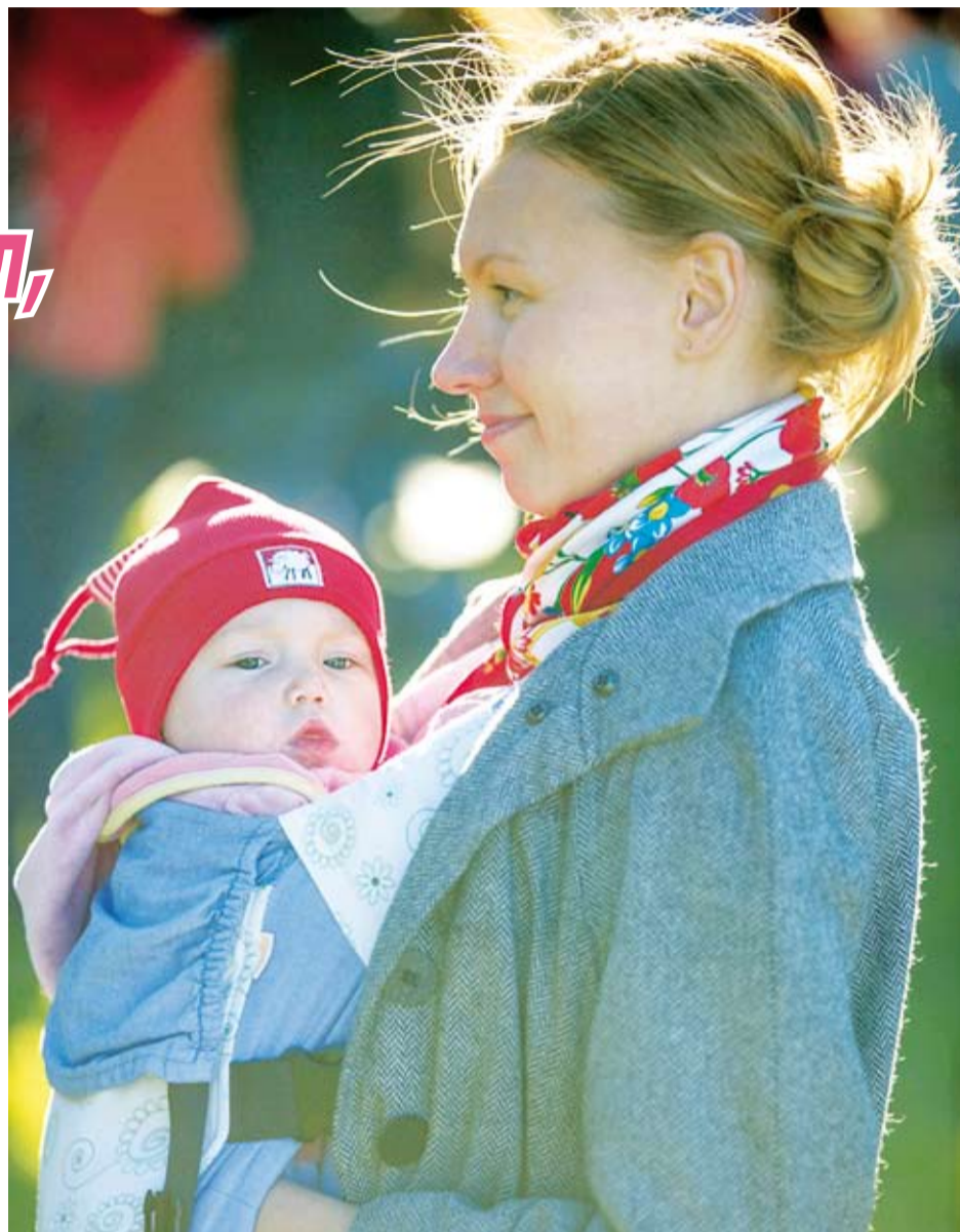
«Счастливая мама».

● Признание за зачатым ребенком статуса человеческого существа, жизнь, здоровье и благополучие которого дол-