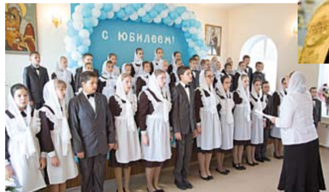
Поздравление от учащихся православной школы при храме

Духовное чадо известного старца архимандрита Кирилла (Павлова), отец Пётр своё священническое служение на Рязанской земле начал в 1973 году. Под его руководством были восстановлены восемь храмов Рязанской епархии, практически заново отстроено в Рязанском кремле здание для