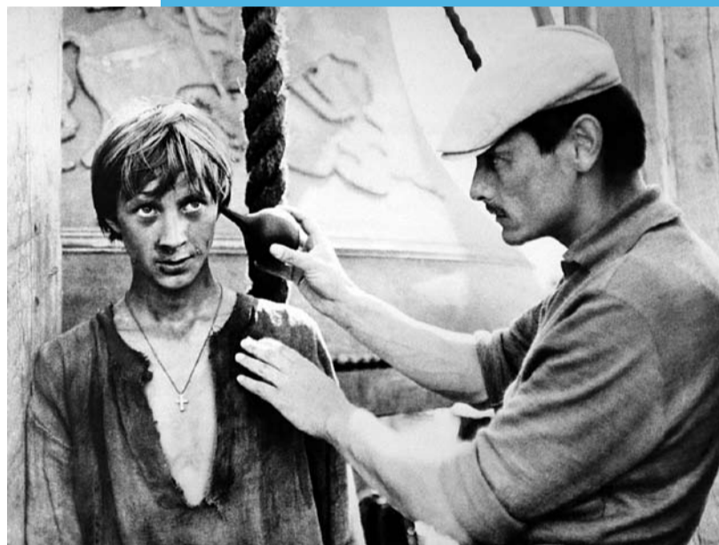
Андрей Тарковский и Николай Бурляев на съемочной площадке. Подготовка сцены из фильма «Андрей Рублев»

«Нельзя боготворить, ибо "не сотвори себе кумира", но уважение безмерное, потому что это – режиссер номер один. И это говорю не только я, это говорят великие режиссеры всего мира, что Тарковский – режиссер номер один. Выше нет» Н. Бурляев об Андрее Тарковском