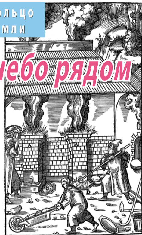
Плавильная печь (гравюра из книги Г. Агриколы «О горном деле и металлургии», 1557 г.)

В Рязанской области много интересных мест, которые ознаменованы прекрасной природой, историческими событиями и известными, прославившими Россию людьми. И везде есть храмы, возведенные в своём величии или только ждущие, когда в них будут возноситься молитвы к Богу. Одним из самых богатых на достопримечательности районов является, пожалуй, Старожилковский. Примечательно, что именно здесь по воле Петра I в селах Коленцы и Столпцы возникли первые в России игольные фабрики, а в селе Истье был открыт железодельный завод, от которого до сих пор сохранилась старейшая в Восточной Европе доменная