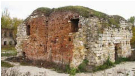
Доменная печь в Истье

печь. Недалеко от сел Истье и Столпцы на берегу реки Прони находится село Перевлес, в котором была одна из самых больших пристаней на Рязанской земле. Она служила в том числе и для перевозки заводской продукции. Конечно, в каждом из этих сел есть своя церковь. И хотя построены они были