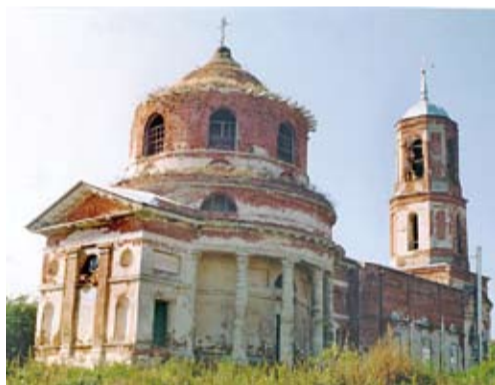
Храм Рождества Христова

в разное время, разными архитекторами, в разных стилях, каждая из них прекрасна по-своему. И наше повествование прежде всего о них – Домах Божиих.