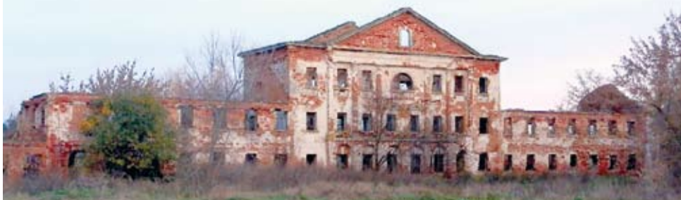
Игольная фабрика в Коленцах