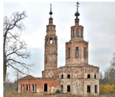
Храм Благовещения Пресвятой Богородицы

Финишной чертой нашего путешествия по селам Старожилковского района станет село Коленцы . Сейчас в нем постоянно живет около 20 человек, но чуть более века назад здесь кипела жизнь. Игольная фабрика давала работу нескольким сотням жителей. А всего в Коленцах в конце XIX века проживало более 2000 человек. Главный корпус игольной фабрики, который был перестроен в самом конце XVIII века, дошел до наших дней: от него остались только стены, обильно поросшие