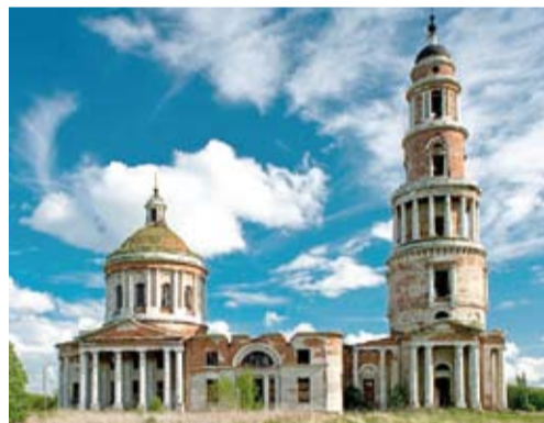
Храм Рождества Пресвятой Богородицы

Самая старинная часть храма сейчас пребывает не в лучшем состоянии. Белокаменный декор ротонды и лестница, ведущая на хоры, крошатся. Росписи не сохранились, а помещение храма облюбовали голуби. Но, несмотря на такое удручающее положение дел, Рождественский храм по праву считается одним из чудес Рязанского края.