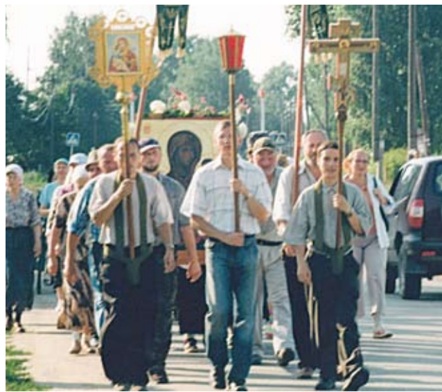
Крестный ход в Федотьево, 2007 год

Несколько лет на его базе отдыха в Сумбулово, как на летней даче, отдыхали учащиеся православной гимназии во имя святителя Василия Рязанского. Здесь он построил часовню, которая была освящена по чину храма и с кото-