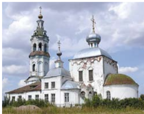
Храм Преображения Господня

Несколько лет назад храм стали потихоньку восстанавливать за счет частных пожертвований. Перекрыли зияющую дыру в трапезной, обновили купол церкви. Но сейчас восстановительные работы заморожены из-за нехватки средств.