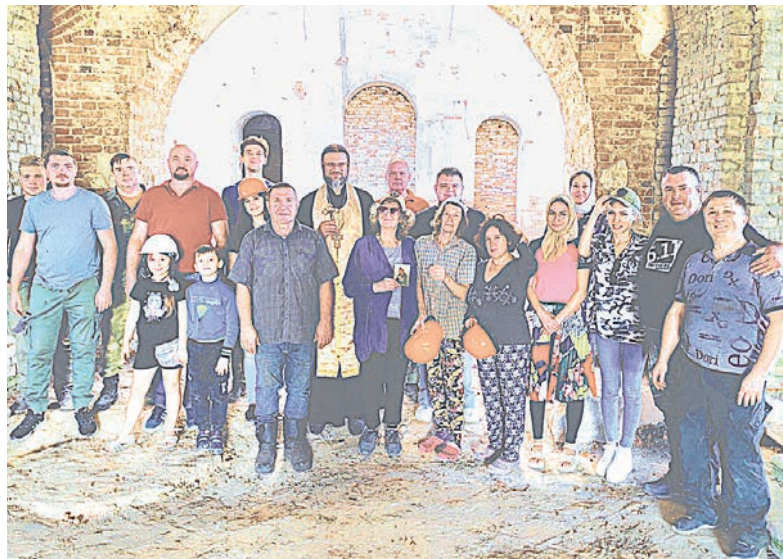
После субботника в храме села Подлесное

Ныне дело уже обстоит несколько иначе, процесс восстановления храмов замедлился. Отчасти это объяснимо тем, что в тех населённых пунктах, где многолюдно и в своё время нашлись люди, готовые посвятить себя делу реставрации поруганных святынь, храмы уже восстановлены и идёт полноценная приходская жизнь, а малолюдным и