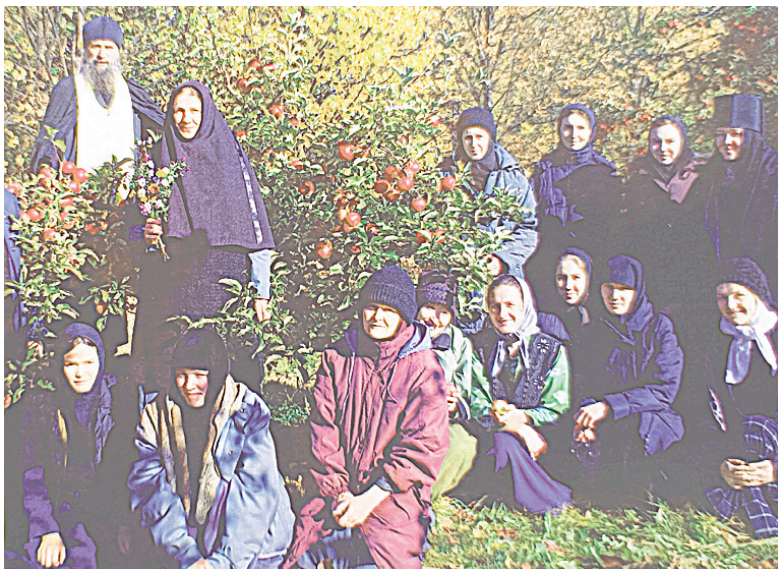
В монастырском саду. 2019 г.

Продолжение материала об удивительной истории возрождения Покровского женского монастыря, расположенного недалеко от города Михайлова. Начало в № 10 (370) 2024 г.