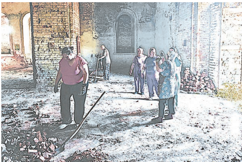
На субботнике в храме села Дмитриево