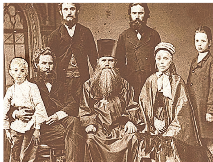
Семья Павловых. И.П. Павлов - первый ряд, второй слева.