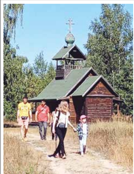
Дорога к храму