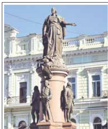
Памятник Екатерине II и её сподвижникам в Одессе

Серьезным ударом по Православной Церкви стало подписание императрицей в 1764 г. указа о секуляризации церковных земель. Указ о секуляризации церковных земель был подготовлен еще императором Петром III, но он не успел его реализовать. В результате реформы Православная Церковь перестала быть полноправным собственником земли, а превратилась в некоего арендатора земель у государства, что, естественно, серьезно подрывало ее экономическое благосостояние. Если раньше Церковь и духовенство