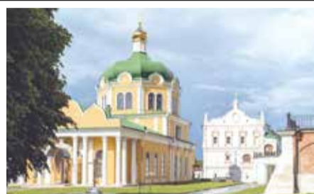
В праздник Успения Пресвятой Богородицы исполняется 500 лет пребыванию Рязанской