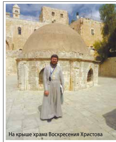
На крыше храма Воскресения Христова

Гробницы других королей эпохи крестоносцев – в Кафоликоне. Именно его алтарь полукругом обходит закрытая обводная галерея, которая идет от придела Адама. Этот алтарь мы видели сверху с Голгофы. Соответственно, вход в Кафоликон – с противоположной стороны, то есть со стороны Кувуклии. Его боковую (южную) стену мы видели за Камнем Помазания – сразу, как вошли в храм. «Кафоликон» – слово греческое, переводится как «соборный храм». Это центральная часть всего храмового комплекса, в ней расположен православный престол. На нем служат утреню в ночь на воскресенье. После этого переходят в Кувуклию для служения Литургии, но причащают затем опять же в Кафоликоне. Когда Господь сподобил нас так причаститься, мы вышли из Кафоликона правой дверью и прошли через галерею в придел Адама. Там в ночь на воскресенье православные греки открывают дверь в следующее свое помещение под Голгофой – реликварий