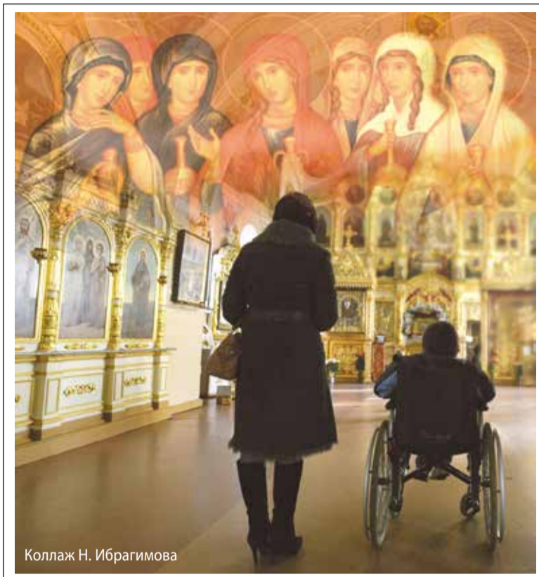
Коллаж Н. Ибрагимова

В православной традиции последних лет стало принято противопоставлять день памяти святых жён-мироносиц наследию советской культуры – Международному женскому дню, 8 марта.