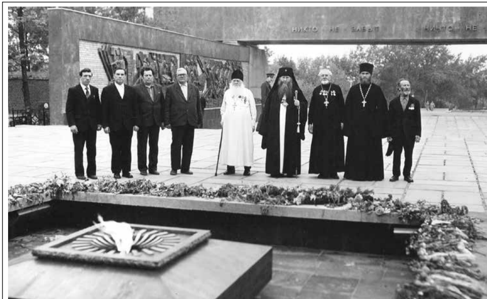
Архиепископ Рязанский и Касимовский Симон с участниками Великой Отечественной войны на Skorbyashensком мемориале Рязани. 1985 г.

В историко-архивный отдел Рязанской митрополии в свое время поступил большой объем документов из епархиального управления. Среди них были списки священнослужителей епархии – участников Великой Отечественной войны.