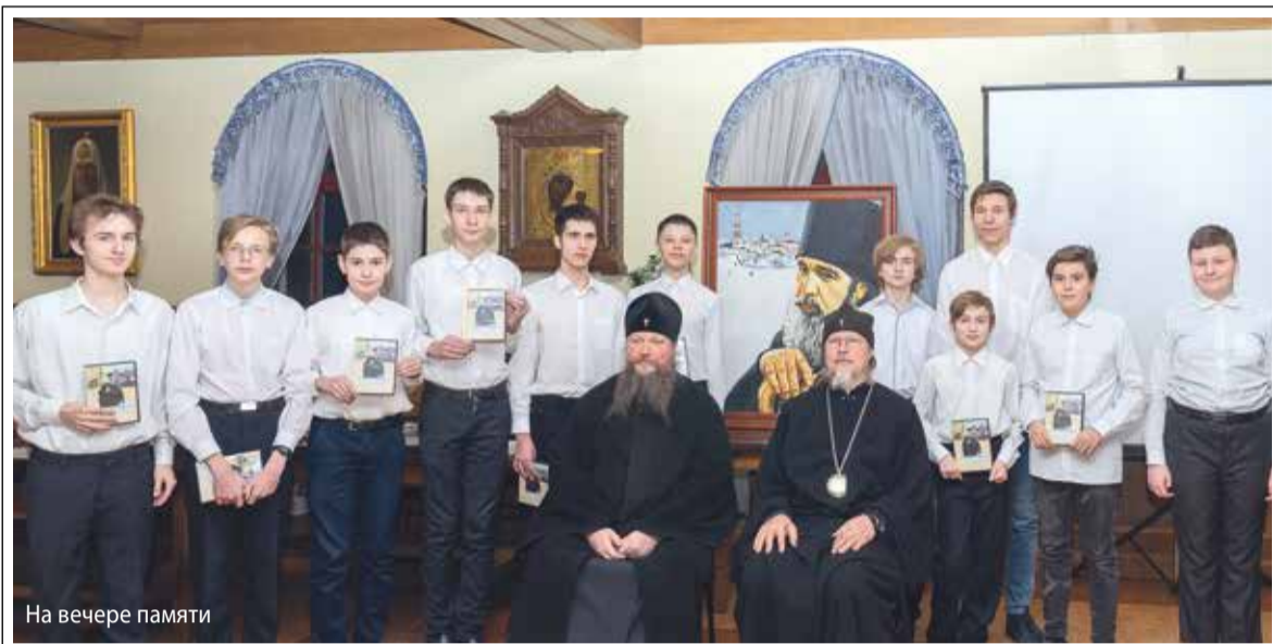
На вечере памяти

Уже 15 лет в день преставления приснопамятного архимандрита Авеля (Македонова), старца, возродившего Иоанно-Богословский монастырь, в этой древней обители собираются его многочисленные духовные чада.