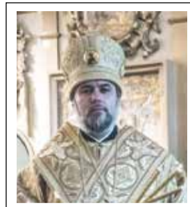
Епископ Касимовский и Сасовский ВАСИЛИЙ

Нет радости во всей Вселенной Сильней, чем радость Воскресенья; Светлей, чем свет Преображенья; Прозрачней, чище радости Крещенья. Но для всего живого существа Нет долгожданной счастья Рождества.