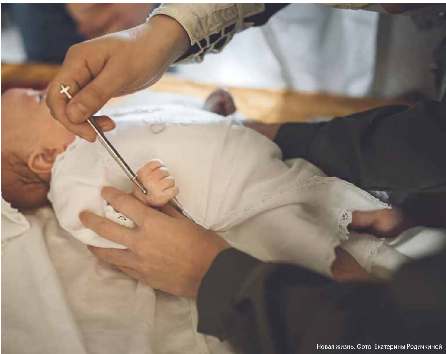
Новая жизнь.