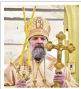
Епископ Скопинский и Шацкий ПИТИРИМ