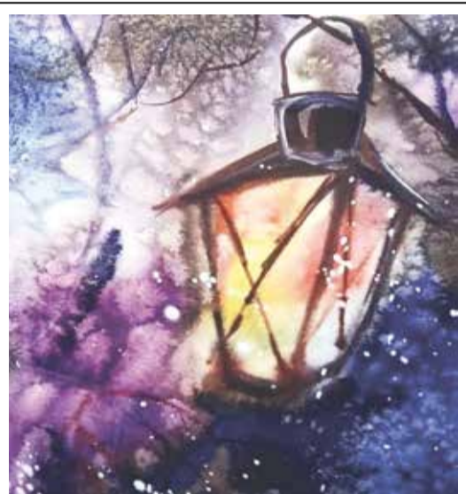
Рисунок Анны Монастыревой

– Как ты едешь в Питер?.. Одна?.. В 19 лет?.. – расстроенная