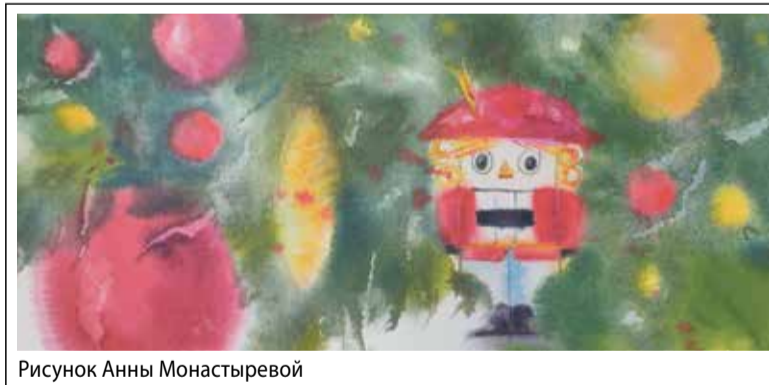
Рисунок Анны Монастыревой

Я снова молчу, Боженьки мне еще не встречались... – Мама, а Он добрый?