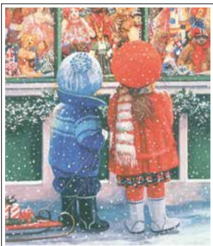
Когда мы становимся старше, список желаний на Новый год становится все меньше и меньше, а то, что мы действительно хотим на Новый год – нельзя купить за деньги.

Уважаемые читатели, не забудьте подписаться! Продолжается подписка на I полугодие 2022 года.