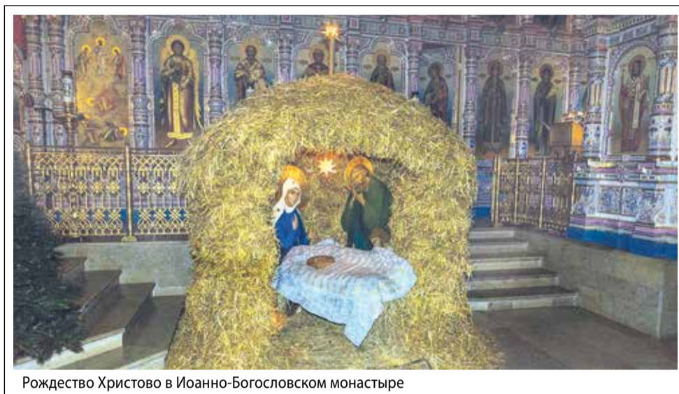
Рождество Христово в Иоанно-Богословском монастыре

можно ощутить в наше время, когда, по прошествии более двух тысяч лет от явления Бога во плоти, несмотря на умножившееся, как морской песок, человечество, так мало тех, кто следует по пути Христовых заповедей. Но именно благодаря тем, кто остался верен Богу, родившемуся в Вифлеемской пещере, снова наступает Рождество и новый год сменяет старый.