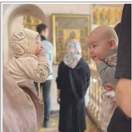
Хорошо, когда ты с младенчества находишь того, кто тебя понимает!