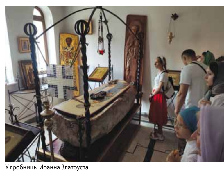
У гробницы Иоанна Златоуста