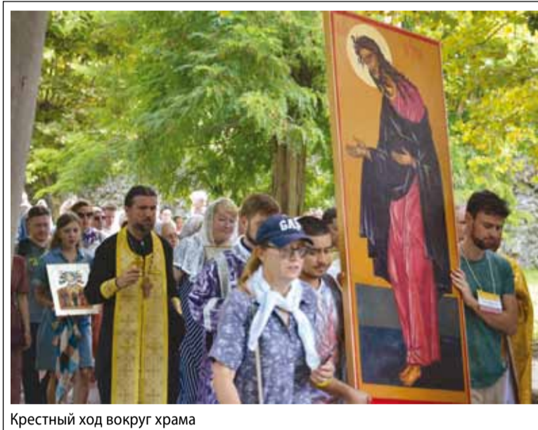
Крестный ход вокруг храма

В первый день фестиваля, в воскресенье, у нас прошло одно из главных событий – Божественная Литургия. И это было действительно нечто удивительное: мы шли крестным ходом через реликтовый лес от нашего пансионата до церкви и молились у стен самого древнего храма в Абхазии – собора