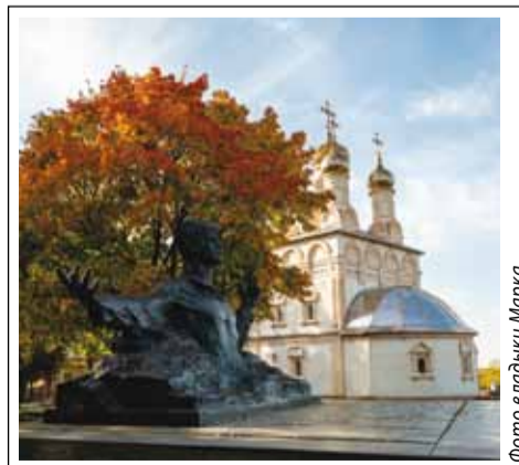
Фото владыки Марка