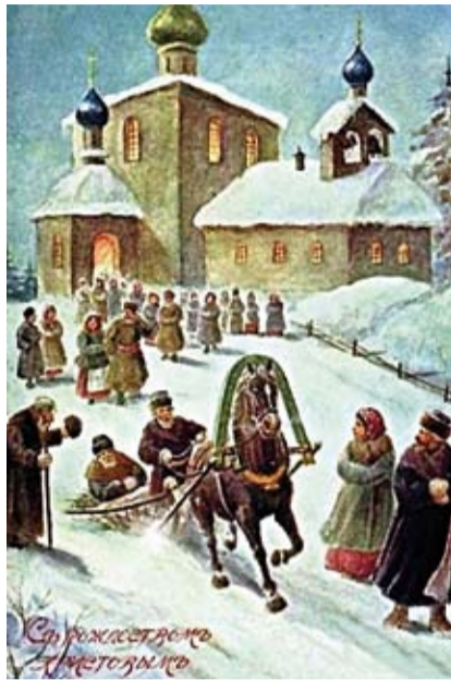
(Окончание. Начало на 1 стр.)

С религиозной точки зрения, день Нового года празднуется в благодарение Богу за благодеяния, полученные от него в прошлый год. Однако дата 1 марта в качестве Нового года не отменялась. В 1342 году при митрополите Феогносте на Московском соборе состоялись прения о начале Нового года. Тогда было решено начинать как гражданский, так и церковный год с 1 сентября. В 1505 году был утверж-