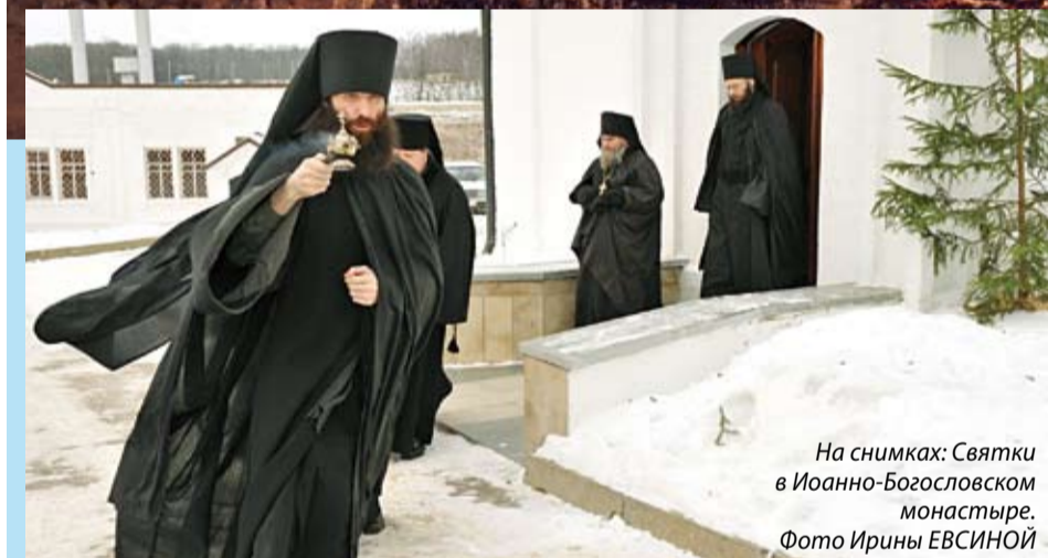
На снимках: Святки в Иоанно-Богословском монастыре.