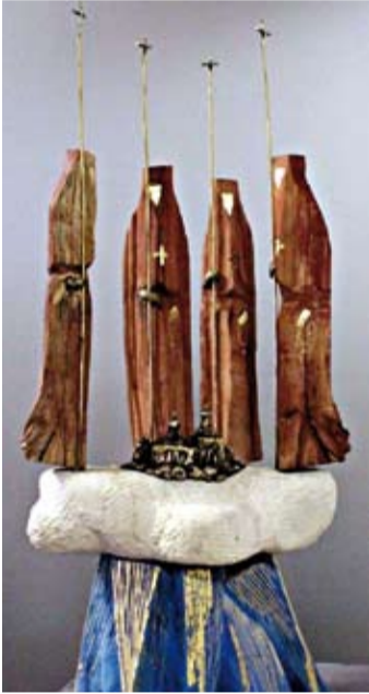
По материалам сайта Казанского монастыря города Рязани

«Четыре игумены – четыре молитвенные судьбы, положившие жизни за Господа нашего Иисуса Христа и на процветание некогда крупнейшего монастыря в Рязани. Как выразить образы игуменей, упокоившихся на некрополе женского Казанского монастыря? И вот приходит озарение: четыре – это четыре угла храма, это непоколебимая устойчивость четырех стен собора! Образы игуменей превращаются в хранительниц, парящих на облаке, где в центре – душа монастыря. Четки и игуменские посохи, напоминающие кресты, говорят о том, что невидимое молитвенное стояние хранительниц-игуменей, окружает женский монастырь нерушимой стеной».