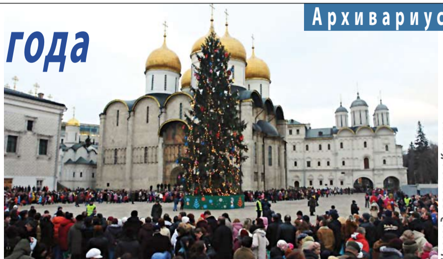
Новогодняя елка в Кремле