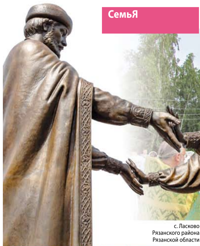
с. Ласково Рязанского района Рязанской области

Но бракосочетания, которые стали повсеместно совершать в этот день, Русская Православная Церковь предлагает перенести на 13 сентября, день перенесения мощей святых благоверных Петра и Февронии.