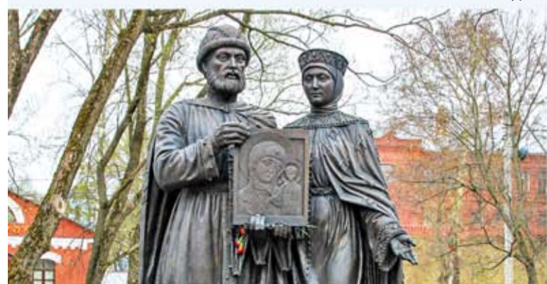
г. Сергиев Посад