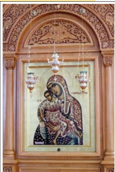
Чудотворная икона Божией Матери «Милостивая» в Кадомском Милостиво-Богородицком женском монастыре

В монастыре: служенье Господу, душевный мир и чистота.