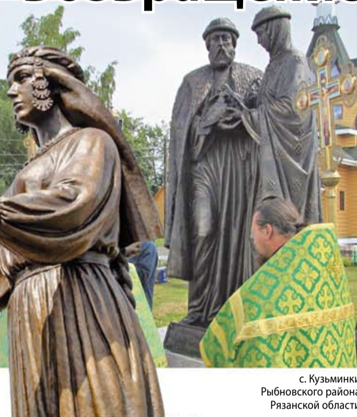
с. Кузьминки Рыбновского района Рязанской области