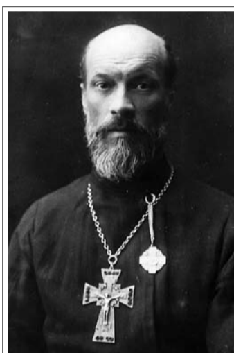
Отец Сергей Правдолюбов

Небесным покровителем Троицкого храма является священноисповедник Сергей Правдолюбов. Он служил здесь 12 лет, а сейчас его мощи покоятся здесь под резной сенью. Когда восстанавливался храм, возродилась традиция – служить молебны с акафистом перед иконой Божией Матери «Взыскание погибших».