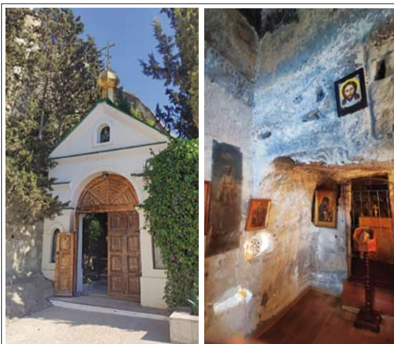
Климентовский пещерный монастырь в Инкермане