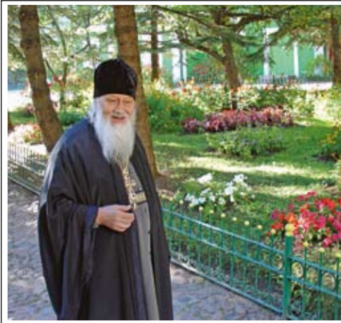
В Псково-Печерском монастыре, октябрь 2005 г.