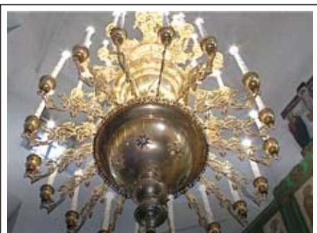
То самое паникадило

подъехала к храму большая машина с громоздкими ящиками в кузове – обещание было выполнено.