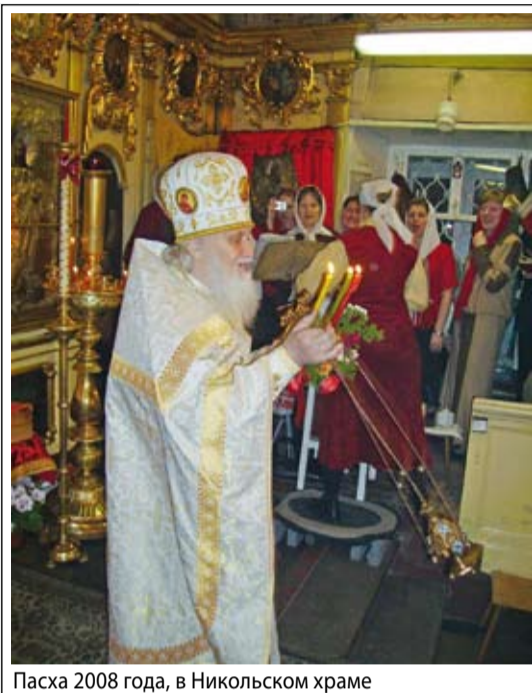
Пасха 2008 года, в Никольском храме

– Я мечтал о священстве с детских лет. Но, повзрослев, понял, что абсолютно не готов к такому серьезному шагу. Видя перед собой замечательные примеры пастырского служения и настоящие духовные высоты, я считал себя недостойным принятия священнического сана. Поэтому после окончания школы поступил на механико-математический факультет Московского государственного