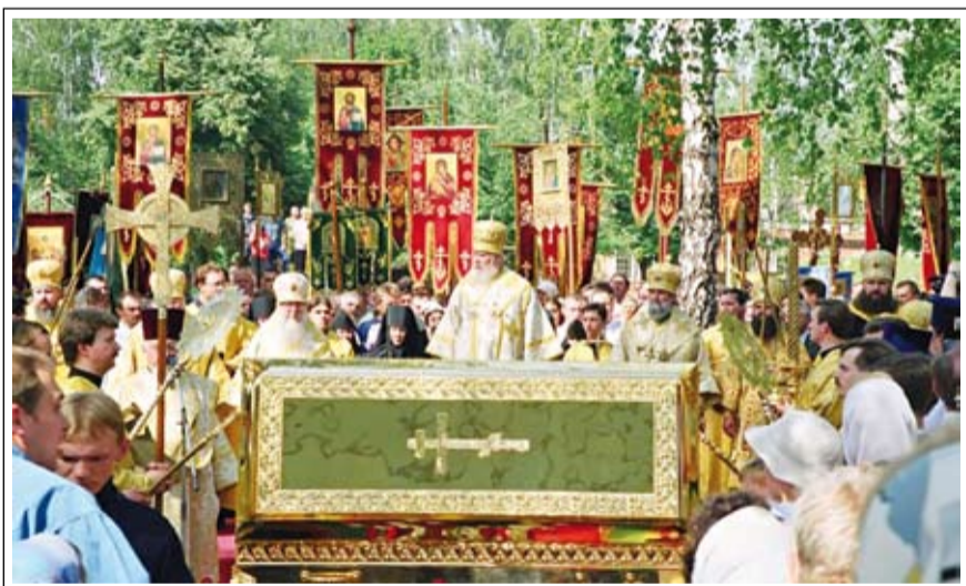
Перенесение мощей святителя Феофана Затворника

Когда в 1990 году Вышенскую обитель частично передали епархии, было принято решение о возвращении мощей святителя, который уже был прославлен в лике святых. В монастыре только-только начинала теплиться монашеская жизнь. Был отреставрирован небольшой Успенский храм. Два других собора – Казанский и Христорождественский – стояли в запустении. Монахи жили в