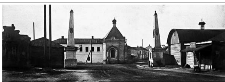
Часовня на Ямской заставе

в честь посещения в 1819 году Рязани императором Александром I. Государь ехал тогда с юга страны, въезжал в город по Астраханскому тракту. Эту часовню можно увидеть на фотографиях конца 1920-х гг. Сейчас на ее месте находится «Монарший» фонтан.