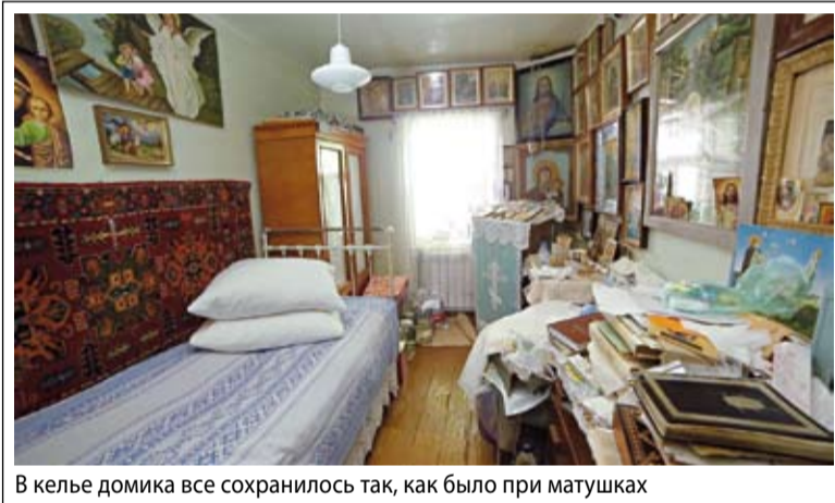
В келье домика все сохранилось так, как было при матушках