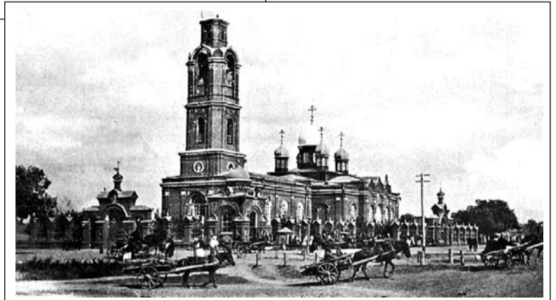
Троицкий храм во всем его великолепии

И еще в своей речи епископ отметил, что жители пригородной слободы Рязани, озабоченные будущим своих детей, без чьего-либо указания решили построить этот храм именно в этом месте. «Чутьем здравого смысла они предполагают, что их детям грозит беда, и вот они спешат для отвращения этой беды создать Божий храм, в котором дети их научились бы бояться Бога и почитать царя...»