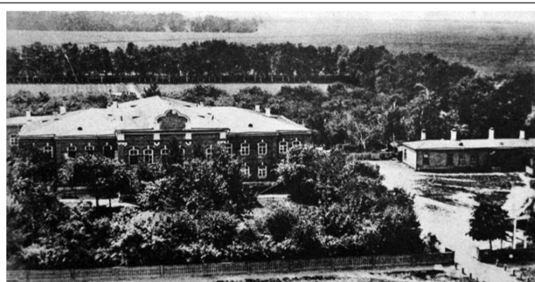
Александровская мужская учительская семинария