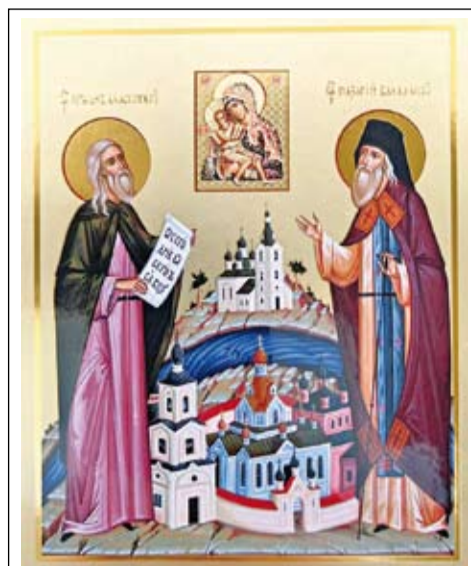
Прп. Герман Аляскинский и прп. Назарий Валаамский