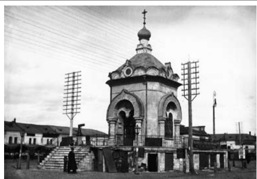
Часовня на Хлебной (Новобазарной) площади

Вторая часовня, посвященная святому князю, находилась ещё на одной центральной площади – Хлебной (ныне площадь Ленина). Ее возвели в 1860 году. Она выглядела как маленькая нарядная церковь, очень украшая площадь. По воспоминаниям жителей Рязани, после революции в ней разместил-