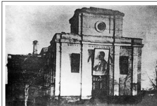
Троицкий храм – клуб МКЖД. Фото до 1960 года

Строили храм пять лет. «Рязанские епархиальные ведомости» отмечали, что новоосвященный храм по своему историческому значению был первым храмом в России – памятником спасению государя-императора. А потому и торжество получилось грандиозное для Рязани.