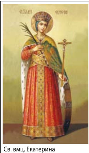
Св. вмц. Екатерина

Где-то в середине 70-х годов ушедшего века нам, как многодетной семье, дали трехкомнатную квартиру почти в самом центре Рязани. Дом стоял поблизости от колхозного рынка, как называли тогда центральный рынок. В то время его территория представляла из себя ряды деревянных прилавков, с которых торговали в основном сельхозпродукцией. Мы часто туда ходили с мамой. Больших павильонов тогда еще не было, но мне запомнился один: кирпичный, с массивными стенами и большими окнами, из которых с противоположных сторон лился свет на обложенные белой плиткой стены и прилавки.