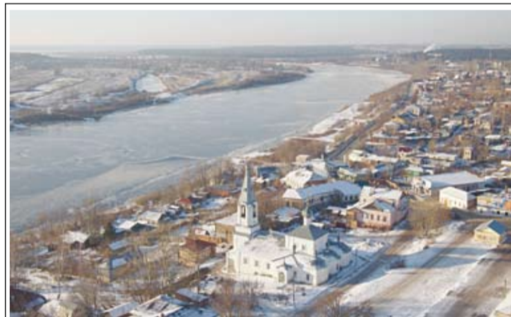
Зимний вид г. Касимова

Беда, когда наши священники к своим прихожанам относятся иначе, когда на прихожан у священников нет времени. Надо искать время, чтобы работать с людьми, а не тратить его на поиск спонсоров, чтобы построить еще одну