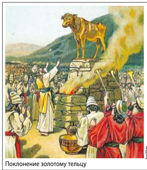
Поклонение золотому тельцу