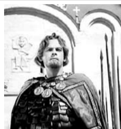
Иллюстрация к статье о князе Александре Невском.