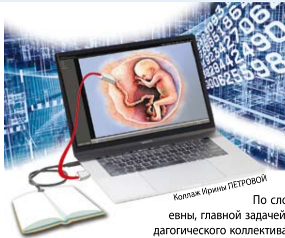
Коллаж Ирины ПЕТРОВОЙ

– Дистанционное обучение стало для нас определенным испытанием. Но нам всё же про-