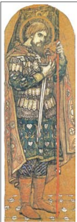
Александр Невский. Эскиз В.М. Васнецова для иконы Владимирского собора в Киеве

Знакомство с историей нашей страны и темой «Александр Невский» натолкнуло меня на одно философское размышление: на мой взгляд, отношение общества к образу Александра Невского в различные периоды отечественной истории может характеризовать отношение к своему прошлому в целом. Это своего рода «лакмусовая бумажка». Судите сами: знакомство широких слоев общества с личностью Александра Невского началось в петровскую эпоху, когда зарождалась наука, когда происходило становление нашей отечественной историографии. В XIX – начале XX века интерес к Александру Ярославичу не ослабевал, а с 1917 по 1937 годы