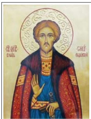
Св. блгв. князь Олег Рязанский

Древняя обитель сыграла важную роль в истории рязанских земель, а в XVI столетии превратилась в один из самых почитаемых и богатых монастырей России. Здесь на протяжении уже многих веков покоятся мощи месточтимого святого – его честная глава. Многие русские земли и княжества давно уже «канули в лету» истории. Рязанская же земля, благодаря ратному и духовному подвигам святого благоверного князя Олега, жива и развивается.