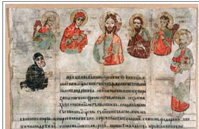
Копия жалованной грамоты великого князя на село Арестовское