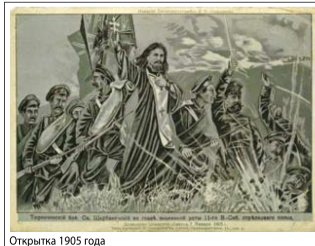
Открытка 1905 года

Первым в истории православного духовенства высшей военной награды России был удостоен священник 19-го Егерского пехотного полка о. Василий Васильковский, герой 1812 года. Во время кровавого боя с французами под Витебском 15 июля 1812 года он шел с крестом вперед, осеняя им воинов,