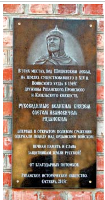
Памятная плита на стене Никольского храма в селе Задубровье

Как известно, Вердеревские – крупные землевладельцы, ветвь Мирославичей, одного из самых знатных родов Рязанского княжества. Род проис-