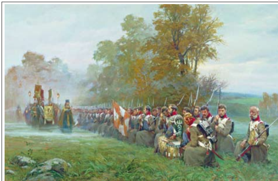
«Молебен перед боем». Худ. Дмитрий Слепушкин