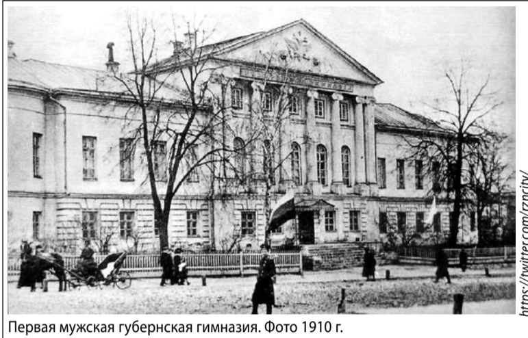
Первая мужская губернская гимназия. Фото 1910 г.

– Рязанский Политех расположен в старинном здании. Раньше