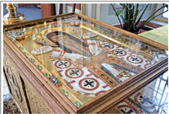
Мощи святителя Василия Рязанского в Христорождественском соборе

Но особенно радостно было рязанцам собраться 23