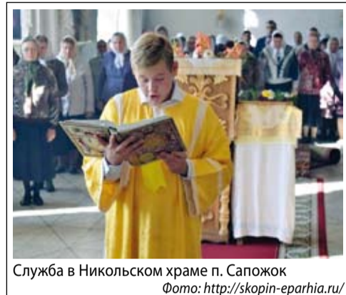
Служба в Никольском храме п. Сапожок

Опыт Никольского храма, подвижническая, многогранная деятель-