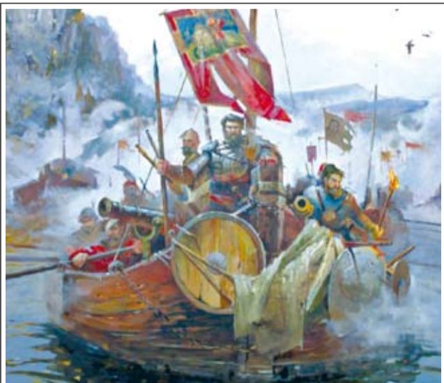
«На Сибирь» (фрагмент). Худ. Андрей Прохоров, 2017 г.

Решено оказать помощь в окосе травы на территории Православной школы, спланировать еще одну благотворительную акцию к новому учебному году, а также продумать проведение «Богатырских забав» после отмены карантинных мероприятий. Вот так мы и дружим с не совсем привычным для наших краев казачьим сословием.