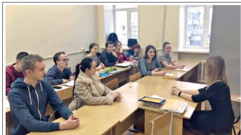
Занятия на кафедре теологии

сиональных служениях реализовывать эту просветительскую задачу. Студенты, отучившиеся на нашем отделении четыре года на звание бакалавра, и особенно отучившиеся еще два года в магистратуре,