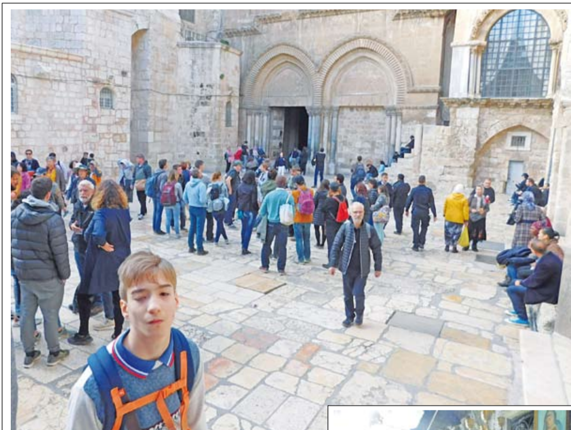
Перед входом в храм Воскресения

частенько забывал подать мне, выходящей из автобуса, свою мужскую руку. В автобусе он также успевал поиграть в гонки на своем смартфоне, что меня страшно раздражало.