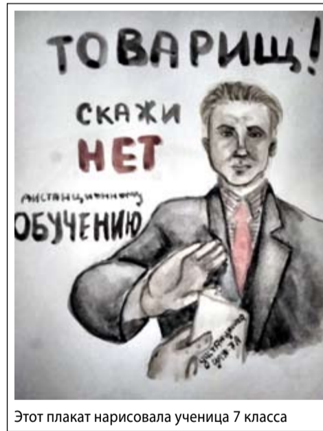
Этот плакат нарисовала ученица 7 класса

вается с помощью всех наглядных средств массовой информации: графики, диаграммы, фото, видео и т.д. и т.п. Какой бы ТВ-канал мы ни включили, везде звучит одна и та же тема: про злой коронавирус. То же происходит и на интернет-ресурсах. Люди встают утром и засыпают, думая только об этом. Но мало кто задумывается о последствиях.