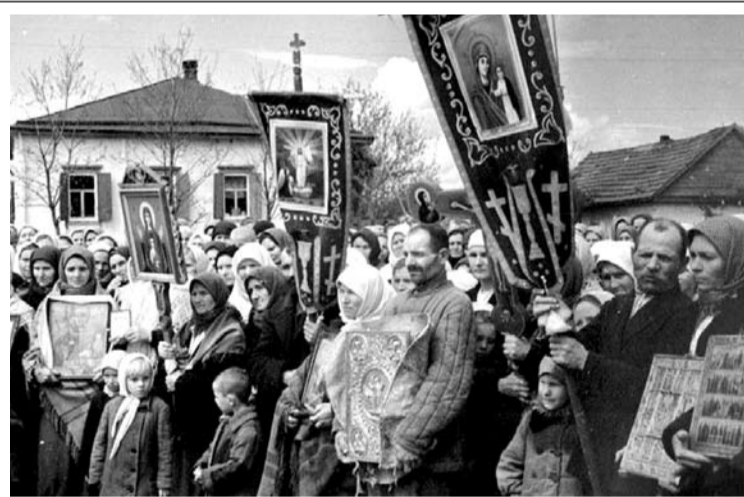
Благодарственный молебен в День Победы в станице Ново-Александровской, Ставропольский край, 1945 г.

В 1942 году на Рязанскую кафедру был назначен архиепископ Алексий (Сергеев) с титулом «Рязанский и Шацкий». К этому времени число приходов в Рязанской епархии сократилось до 2-3 (Скорбященская церковь в Рязани и Никольская в Шацке). 8 сентября 1943 года архиепископ Алексий был участником Собора Русской Православной Церкви, на котором был избран Патриарх Московский и всея Руси Сергей (Страгородский). 26 мая 1944 года епископом Рязанским и Шацким был назначен Димитрий