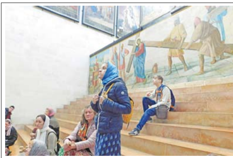
У порога Судных врат