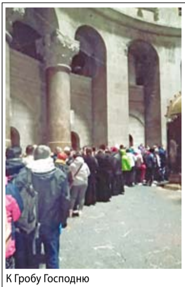
К Гробу Господню

С сознанием собственного тайного подвига и даже героизма протиснулась я на свое место и приготовилась присоединиться к заслуженной трапезе, но не тут-то было! Автобус, двигаясь по современному палестинскому городу с невысокими домами своеобразной местной архитектуры, направился в Русский музей в Иерихоне, где нам предстояла заказанная экскурсия. Вновь преодолевая свои немощи, поддерживаемая личной установкой на преодоление трудностей, я вылезла из уютного кресла и захромала к музею.