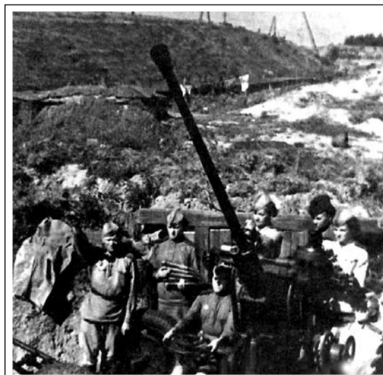
Обучение зенитчиков у кремлевского вала в Рязани.

Власть, в свою очередь, понимая практически невозможность только человеческими усилиями одолеть сильнее врага, тоже повернулась в сторону Церкви. Начали понемногу