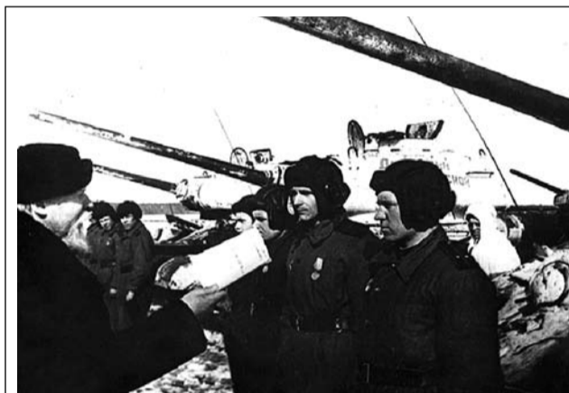
Митрополит Крутицкий Николай вручает одному из танкистов колонны «Дмитрий Донской» формуляр части. 1943 г.

В период войны Русская Православная Церковь оказывала