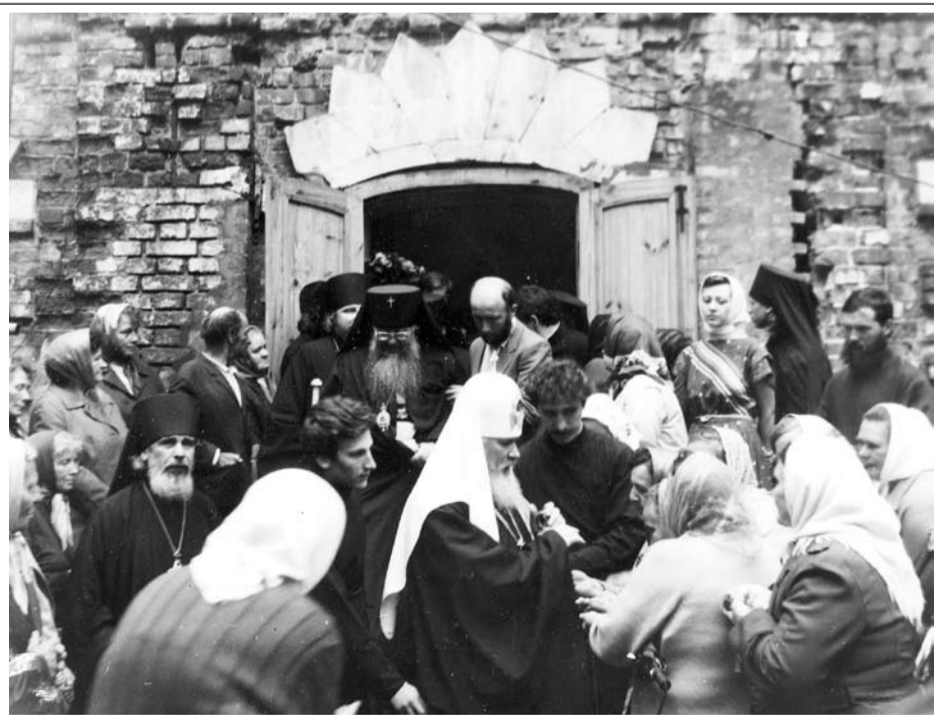
Визит Патриарха Алексия II в Иоанно-Богословский монастырь. 1990 год

Рядом с монастырем расположен единственный в области хос-