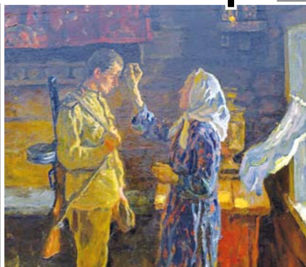
Худ. А.П. и С.П. Ткачевы. Из серии «Сыновья» (фрагмент)

Отец вспоминал, как однажды и ему пришлось переждать артобстрел в одной из таких воронок. Шел ожесточенный бой. От разорвавшихся рядом снарядов ничего не было видно, все окутал плотный дым. Немцы в это время пошли в атаку, и трое из них решили спрятаться от рвущихся снарядов в эту же воронку, где он находился. В дыму враги не увидели нашего бойца, который сразу же вступил с ними в рукопашную схватку. Отец успел застрелить двух немцев, а третий, здоровенный