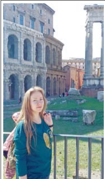
Театр Марцелла построил Октавиан Август и посвятил его памяти своего племянника, умершего в 19 лет. И да, архитекторы Колизея вдохновлялись театром Марцелла. Оба здания очень похожи, но на здешних представлениях не проливалась кровь, и женщинам приходить сюда никогда не запрещалось.

не боялись, и этот момент – молитва души, идущей к Богу, – на самом деле радостный. Он же – самый важный, поэтому два других значительных эпизода ее жизни, брак и рождение ребенка, изображены мельче. В то же время ряд специалистов видят в изображении этой молящейся женщины прообраз будущей иконографии Богоматери Орранты.