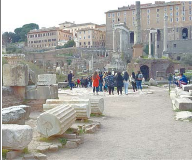
Римский форум – сердце Вечного города. Здесь творилась история Древнего Рима – а значит, и всего мира – на протяжении тысячи лет!

ко в эпоху Возрождения. Римляне решили, что в катакомбах хоронили исключительно святых мучеников, и стали растаскивать кости в качестве святынь... Потом Католическая Церковь в борьбе с этим явлением собрала немногие сохранившиеся останки и перезахоронила.