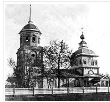
Так выглядела Никольская церковь в Вялсах

Я уверена, что наш храм будет возрожден, как и сотни других в нашей стране, а вместе с ним – и духовная жизнь русского народа.