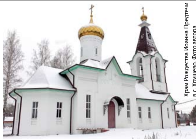
Храм Рождества Иоанна Предтечи в с. Хрущево.