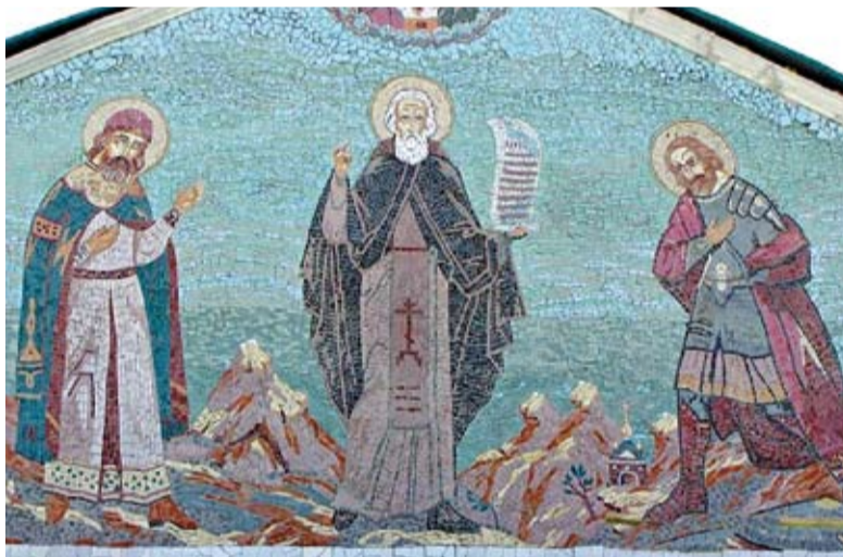
Фрагмент мозаики «Преподобный Сергей Радонежский примиряет благоверных князей Димитрия Донского и Олега Рязанского»

Вести об успехе рязанцев дошли до Новгорода, жители которого были ободрены поражением Москвы и отказались подчиняться власти московского князя. И другие русские князья тоже стали косо поглядывать на Москву. Литовская помощь Рязани не могла не вызвать тревогу у Дмитрия. В свою очередь монголо-татарский хан Тохтамыш очень надеялся на ослабление русских княжеств. Перед московским князем возникла дилемма: или опять начать затяжную войну с усилившимся Рязанским княжеством, или