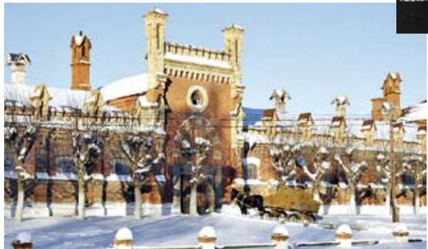
Старожиловский конный завод