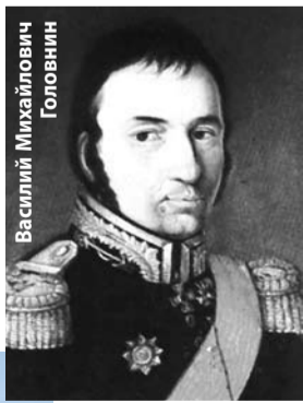
Василий Михайлович Головнин

страны – русская верховая. Так что места эти весьма интересны и значимы.