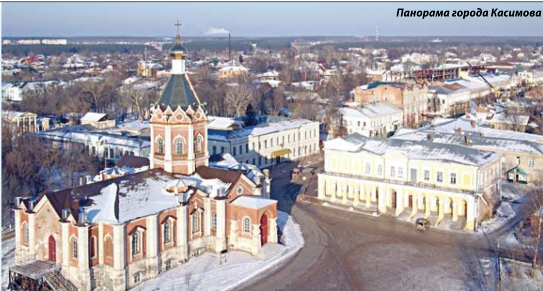
Панорама города Касимова