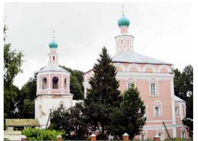
Никола-Успенский собор. Вeneвские монастырь.

Адрес: 390023 г. Рязань, ул. Циолковского, д. 8 (Никола-Ямской храм), 4 этаж. Часы работы: вторник-пятница 10.00-19.00, суббота 12.00-16.00, вс, пн – выходной. Тел: 45-02-33, 8-910-906-44-44, сайт – www.palomnik-rf.ru