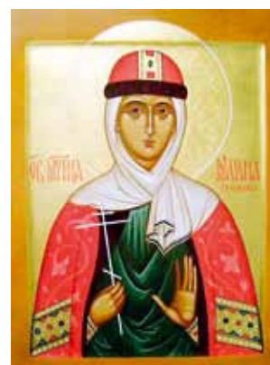
Святая Иулиания Вяземская.

Весной 1407 года больной крестьянин увидел, что по реке Тверце плывёт против течения тело убиенной княгини