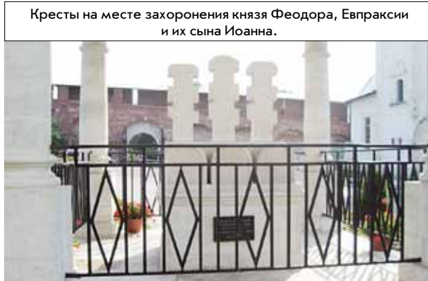
Кресты на месте захоронения князя Феодора, Евпраксии и их сына Иоанна.

Братья и сестры! Вы можете помочь Редакционному совету Рязанской епархии в издании нашей газеты и других печатных проектов, перечислив пожертвования по следующим реквизитам. Местная религиозная организация Православный приход в честь святителя Феофана Затворника Вышинского города Рязани Рязанской Епархии Русской Православной церкви (Московский Патриархат). 390000, г.Рязань, пл.Соборная д.3. ИНН/КПП 6234991397/623401001. ОГРН 1136200000870. Банк: Филиал № 3652 Банка ВТБ 24 (ПАО) в г. Воронеж. К/с 3010181010000000738. БИК 042007738. Р/с 40703810512510000966.