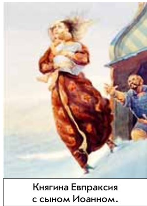
Княгиня Евпраксия с сыном Иоанном.

На месте, где князь Феодор встретил икону, на правом берегу реки Осетр забил источник святой воды. Через несколько лет после явления святителя князь Феодор женился на византийской принцессе Евпраксии, и у них родился сын, названный Иоанном.