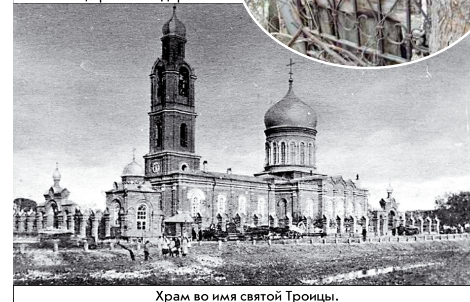
Храм во имя святой Троицы.