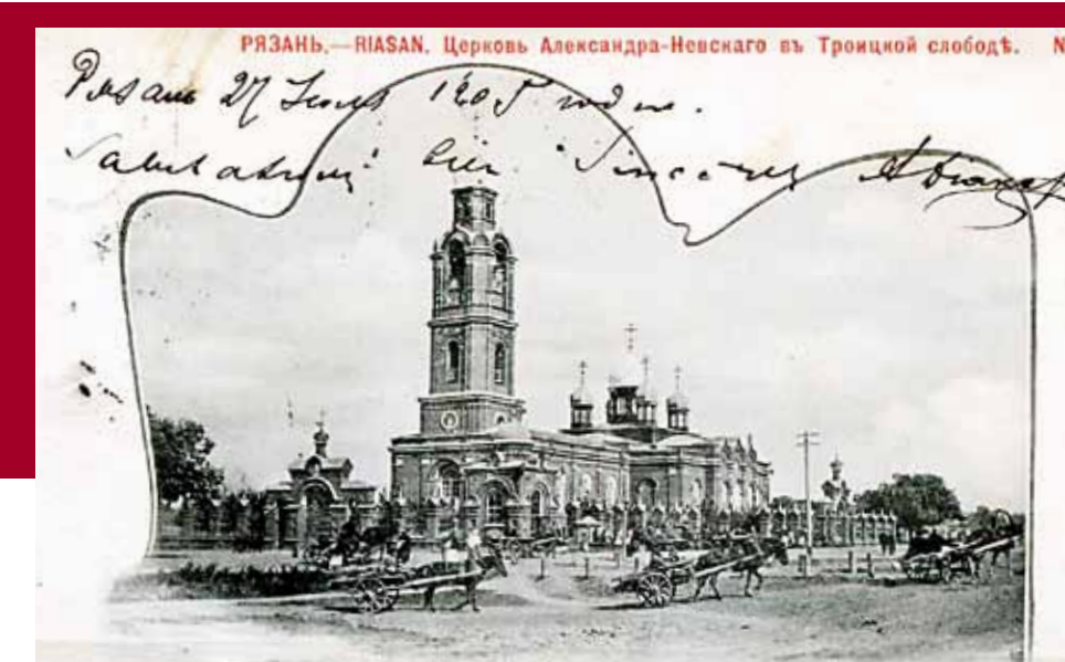
Церковь Александра Невского.