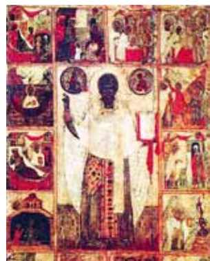
Древнейший список иконы Николая Зарайского XIV вв. Находится в Рязанском кремле.

Узнав о гибели любимого мужа, чтобы не достаться врагу, Евпраксия с сыном бросилась с высокого терема и разбилась насмерть («заразилась», или «сама себе зарази», как сказано об