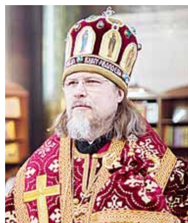
Митрополит Рязанский и Михайловский Марк

Среди всех церковных праздников, посвященных Деве Марии, Успение – один из самых почитаемых. Какой смысл несет он в себе? Говоря простым языком, мы отмечаем кончину земной жизни Пресвятой Богородицы. Одно из песнопений праздника звучит так: «О дивное чудо! Источник Жизни во гробе полагается...».