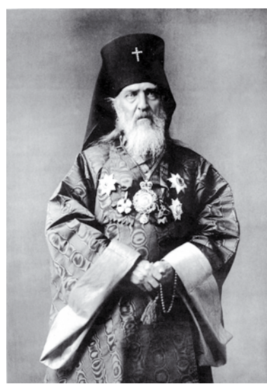
Святитель Николай Японский