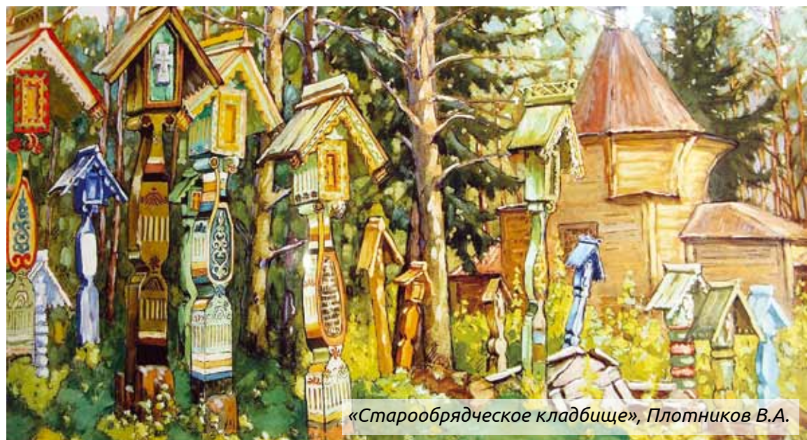
«Старообрядческое кладбище», Плотников В.А.

Во время земной жизни Она жила, отчасти как обычный человек. Пользовалась проявлениями заботы главным образом от близких людей – праведного Иосифа и Своего Божественного Сына. Современ-