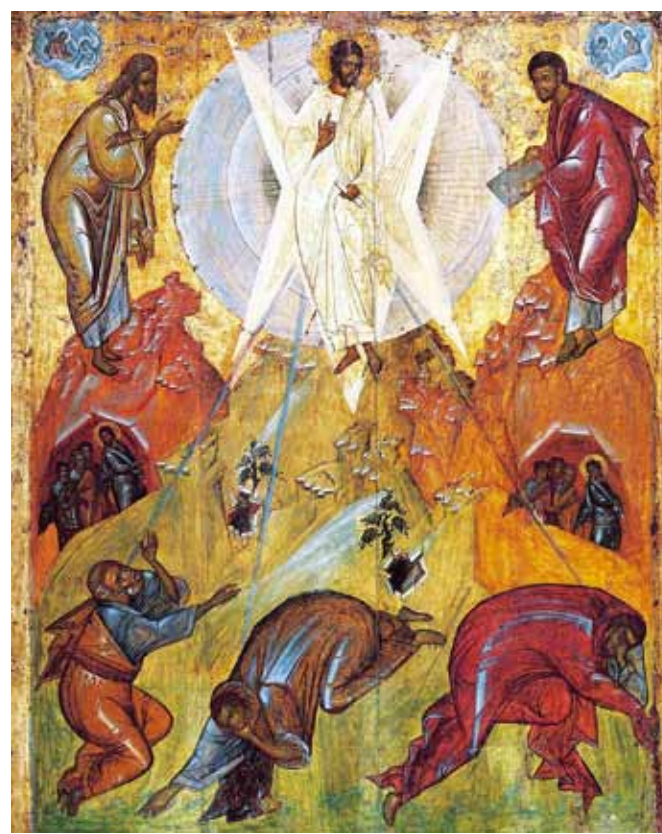
Преображение Господне. Феофан Грек. 1403 год

Всем этим таинственным действием Спаситель раскрыл перед учениками полноту Своего Божества, хотя и находился в таком же человеческом теле, как и у нас. Он открыл для учеников множество тайн, которые будут впоследствии свято храниться Его Церко-