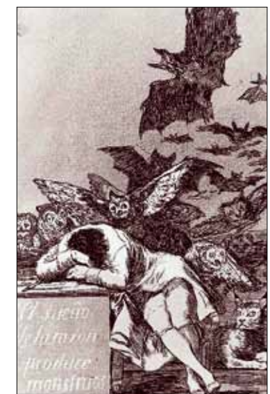
Сон разума рождает чудовищ, Франциско Гойя, 1797 год.

И наконец, я хотела бы предложить основу для самостоятельных размышлений. Давайте вспомним работу Франциско Гойи «Сон разума рождает чудовищ» – на нее можно смотреть под разными углами, она подлежит разным толкованиям и очень многомерна, но нужно обратить внимание, что сон разума – это не глупость, как можно было бы подумать, а эстетически отталкивающие образы. И