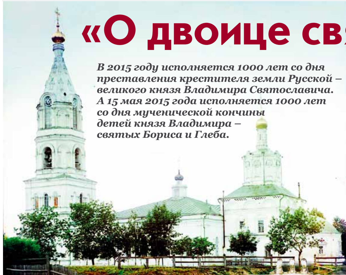
Борисо-Глебский собор. Рязань.

В 2015 году исполняется 1000 лет со дня преставления крестителя земли Русской – великого князя Владимира Святославича. А 15 мая 2015 года исполняется 1000 лет со дня мученической кончины детей князя Владимира – святых Бориса и Глеба.