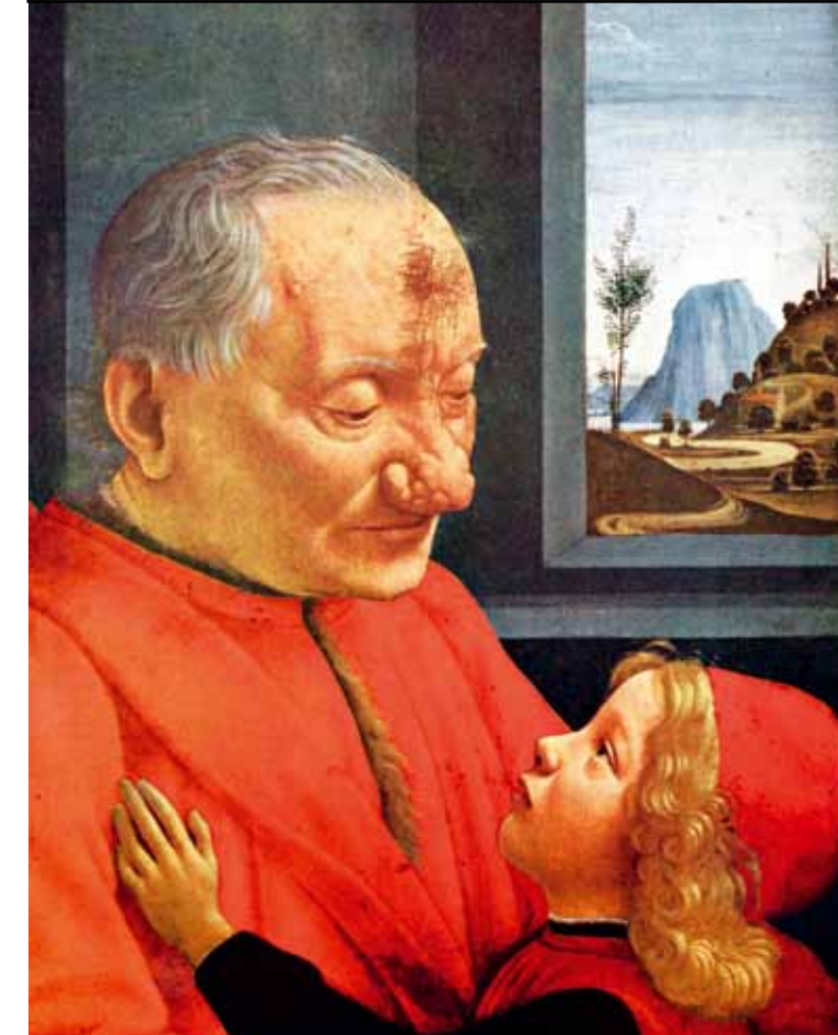
Портрет старика с внуком, Доменико Гирландайо, 1488 год.

старик с большим, болезненным красным наростом на носу, с красным лицом – известная болезнь, она производит не лучшее впечатление. А ребенок изобразен, наоборот, с личиком невероятно чистым и ясным, чрезвычайно хорошеньким.