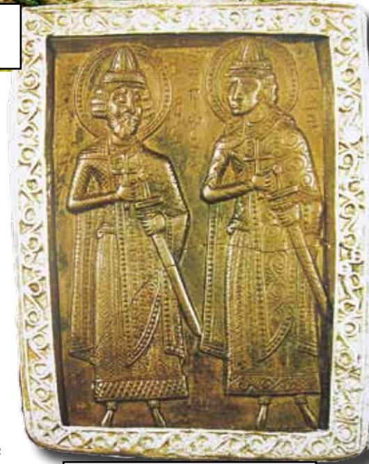
Святые Борис и Глеб. Шиферная икона. XIII в. Старая Рязань

К сожалению, Борисо-Глебский собор в Старой Рязани был разрушен монголо-татарами в 1237 году. В результате археологических раскопок были обнаружены, например, фрагменты фресок из западного притвора храма, на которых сохранились граффити XII-XIII вв.: книжные орнаменты, греческая скоропись, хозяйственные записи, учебная таблица по расчету пасха-