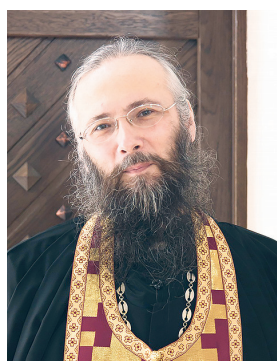
Отвечает игумен Паусий (САВОСИН)

Я крещена в детстве, но во взрослом возрасте долго в храм не ходила. А когда наконец пришла, священник не допустил меня к Причастию, потому что мы с моим молодым человеком живём без регистрации наших отношений. Я считаю это несправедливым, почему священник так поступил?