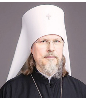
Митрополит Рязанский и Михайловский Марк

Каждый священник, исповедующий прихожан в храме Божиим, время от времени соприкасается с людьми, которые уверяют, что им не в чем каяться.