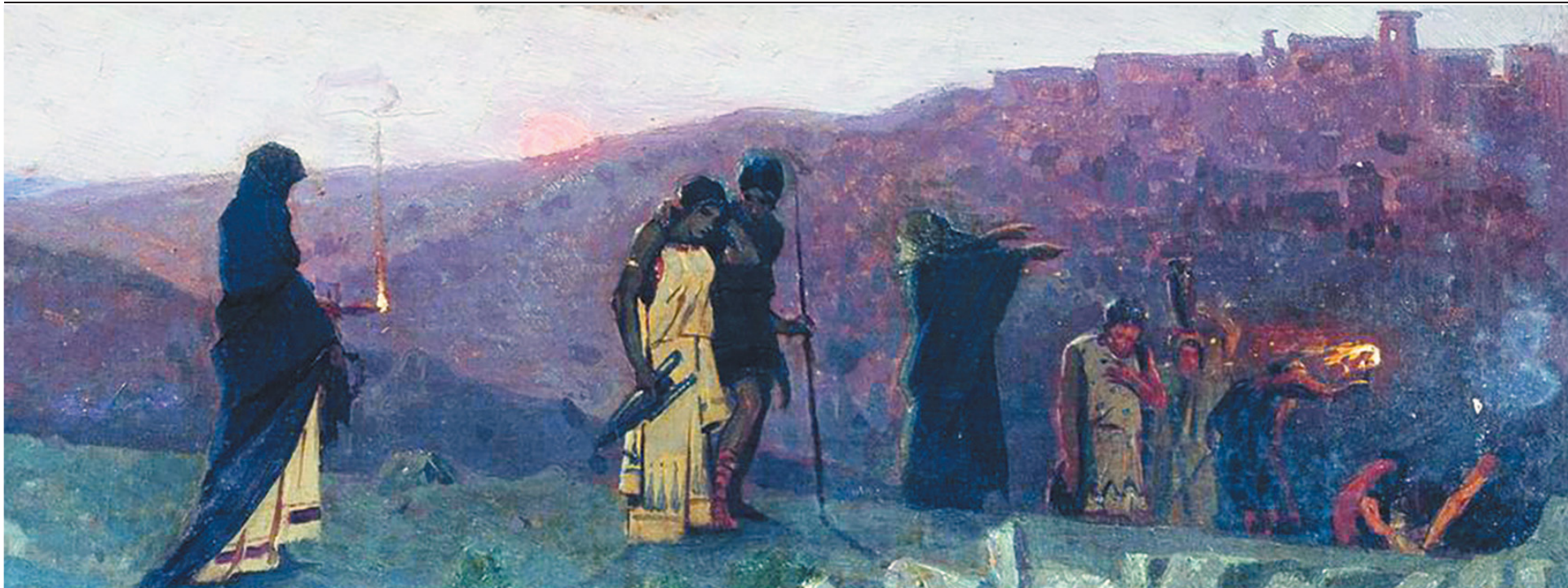
М.В. Нестеров. Мироносицы