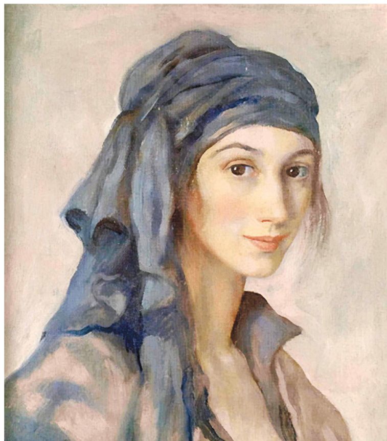
Зинаида Серебрякова. Автопортрет

Все эти примеры подтверждают способности женщин к живописи. Кроме того, детские портреты наиболее тепло и точно получаются именно у женщин. А младенцев и вовсе должны писать матери: мужчины не так привязаны к малышам и делают анатомические ошибки в их изображении. Много раз это замечала даже у именитых авторов. Поэтому я больше скажу: женщина христианка, имеющая талант в искусстве, обязана его раскрывать, ведь её творчество может стать проповедью.