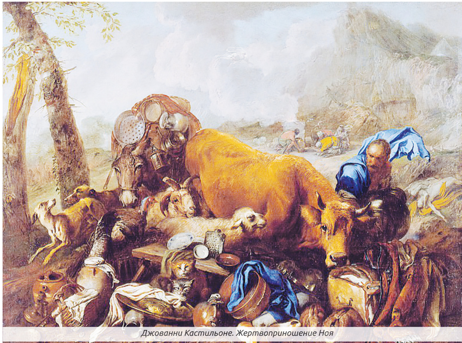
Джованни Кастильоне. Жертвоприношение Ноя

Интересно, что жертва и дар иногда соприкасаются. И это неспроста, между ними много общего. Даже подарки своим родным и