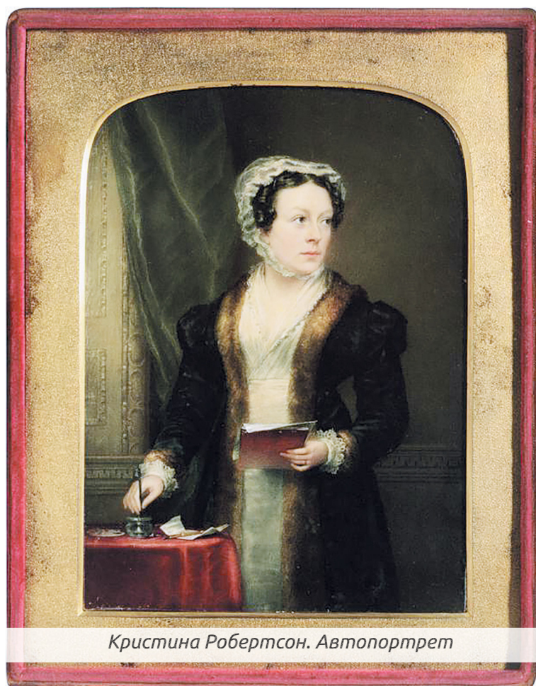
Кристина Робертсон. Автопортрет