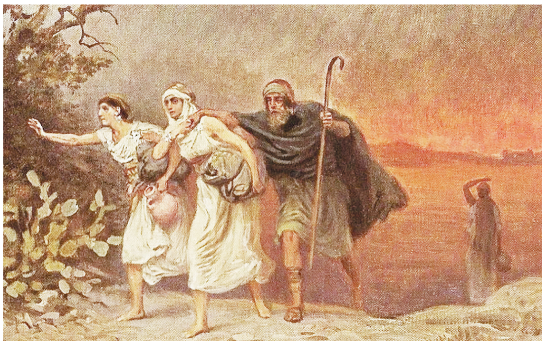
Джон Мартин «Бегство из Содомы и Гоморры»

Таким образом, Священное Предание – это передача Божественного Откровения в Христовой Церкви от поколения к поколению под личным руководством Бога, основавшего эту Церковь, и сказавшего: «Я создам Церковь Мою и врата ада не одолеют Её». И помимо Священного Писания, это, во-первых, передача любого исторического памятника, хранящего Божественное Откровение, такого как постановления Вселенских Соборов или труды святых отцов. Во-вторых, это передача духовного опыта, заключённого в образе действий и личном примере учеников Христа. В-третьих, это передача благодати Святого Духа, некогда сошедшего на Апостолов в день Пятидесятницы и до сегодняшнего дня действующей в епископах, священниках, дьяконах и всяком живущем по вере православном христианине. Однако не всякие изречения и труды святых, а также постановления не всех соборов относятся к Священному Преданию. Как же Церковь отделяет их друг от друга? Церковь уже в первом веке своего существования выработала механизм различения истины от лжи. Но об этом мы поговорим в отдельной статье.