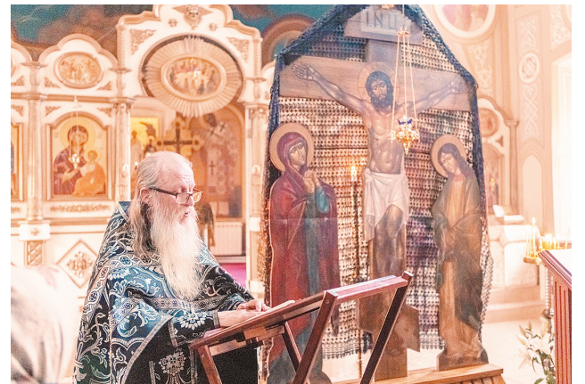
почему священник не советовал этот фильм стр. 3