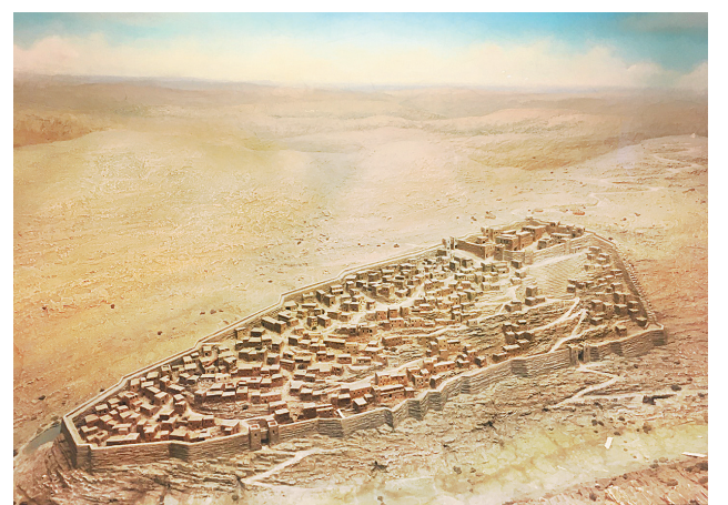
глазами археолога стр.8