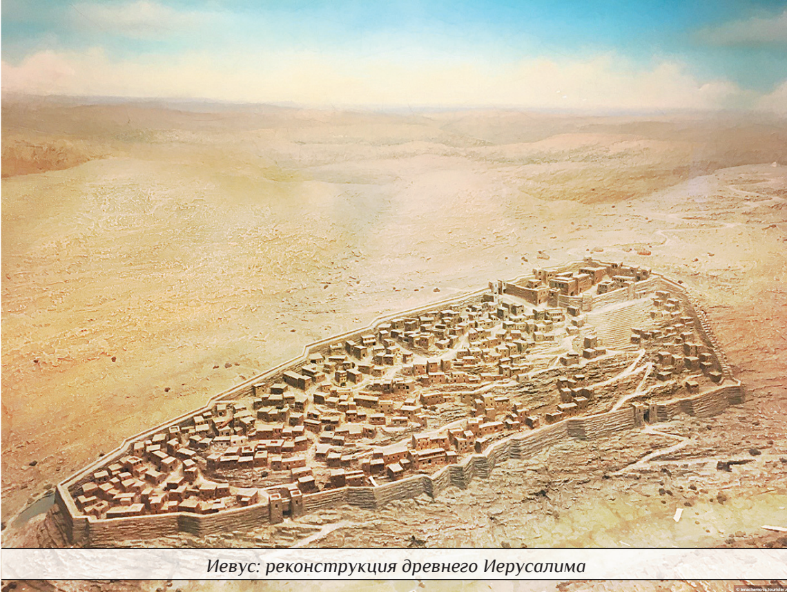
Иевус: реконструкция древнего Иерусалима

ще какой-либо транслитерации непонятного читателю слова. Подлинное название долины к настоящему моменту неизвестно.