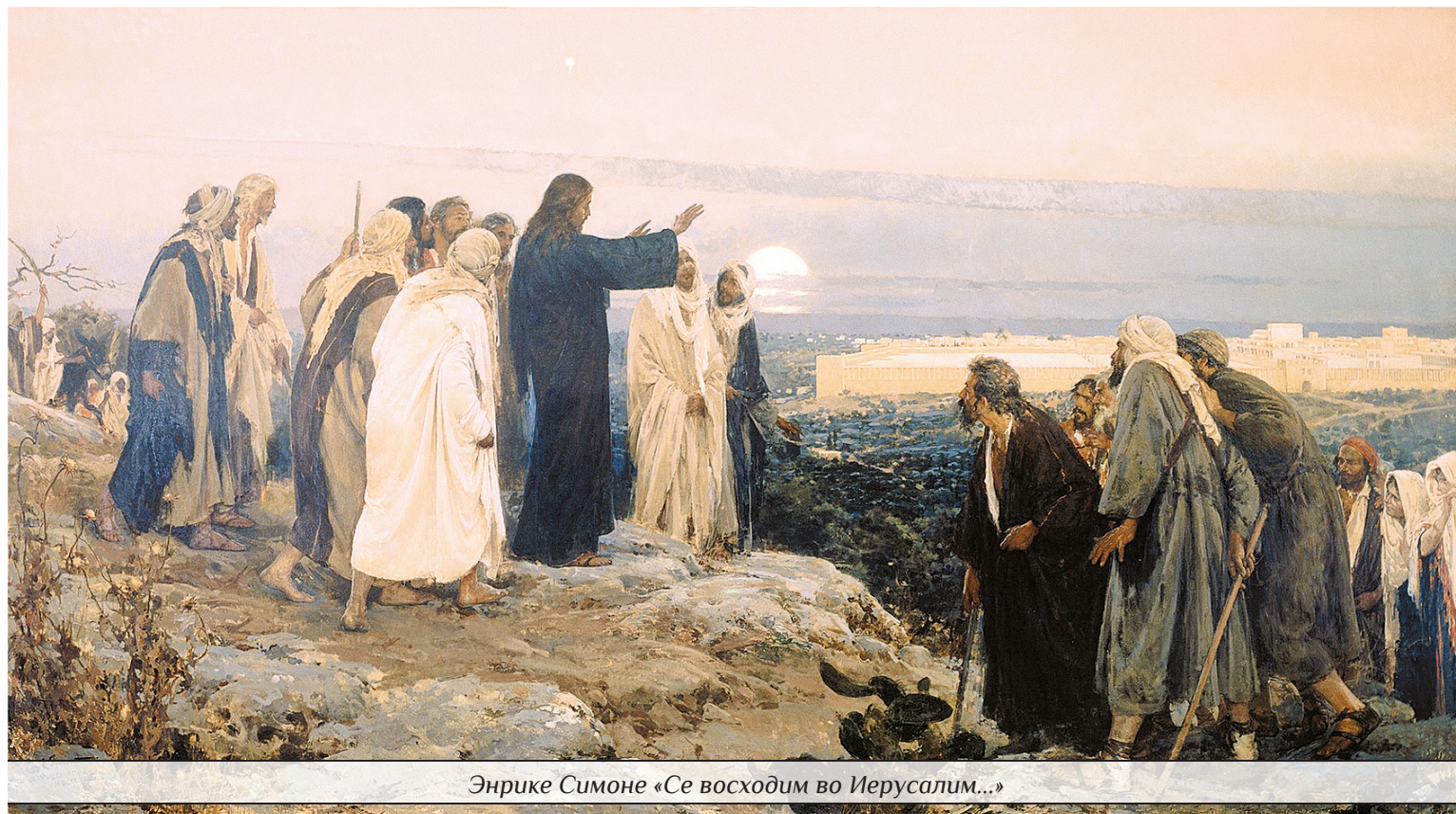
Энрике Симоне «Се восходим во Иерусалим...»

Более того, немало слов из церковнославянского языка являются терминами христианского богословия. Одно из таких слов – «предание». В данной статье поговорим о том, что такое Священное Предание, чем оно отличается