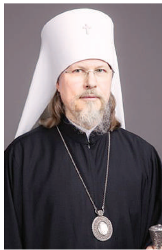
Митрополит Рязанский и Михайловский Марк

денный». Он, как молодой росток, появившийся на церковном поле. Какова же особенность периода неопитства?