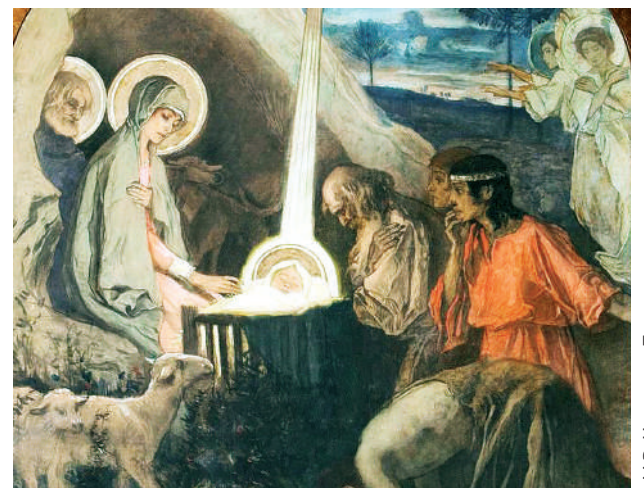
М.В. Нестеров. Поклонение пастухов, эскиз росписи

Разбираем богослужебные тексты Рождества стр.2, 4