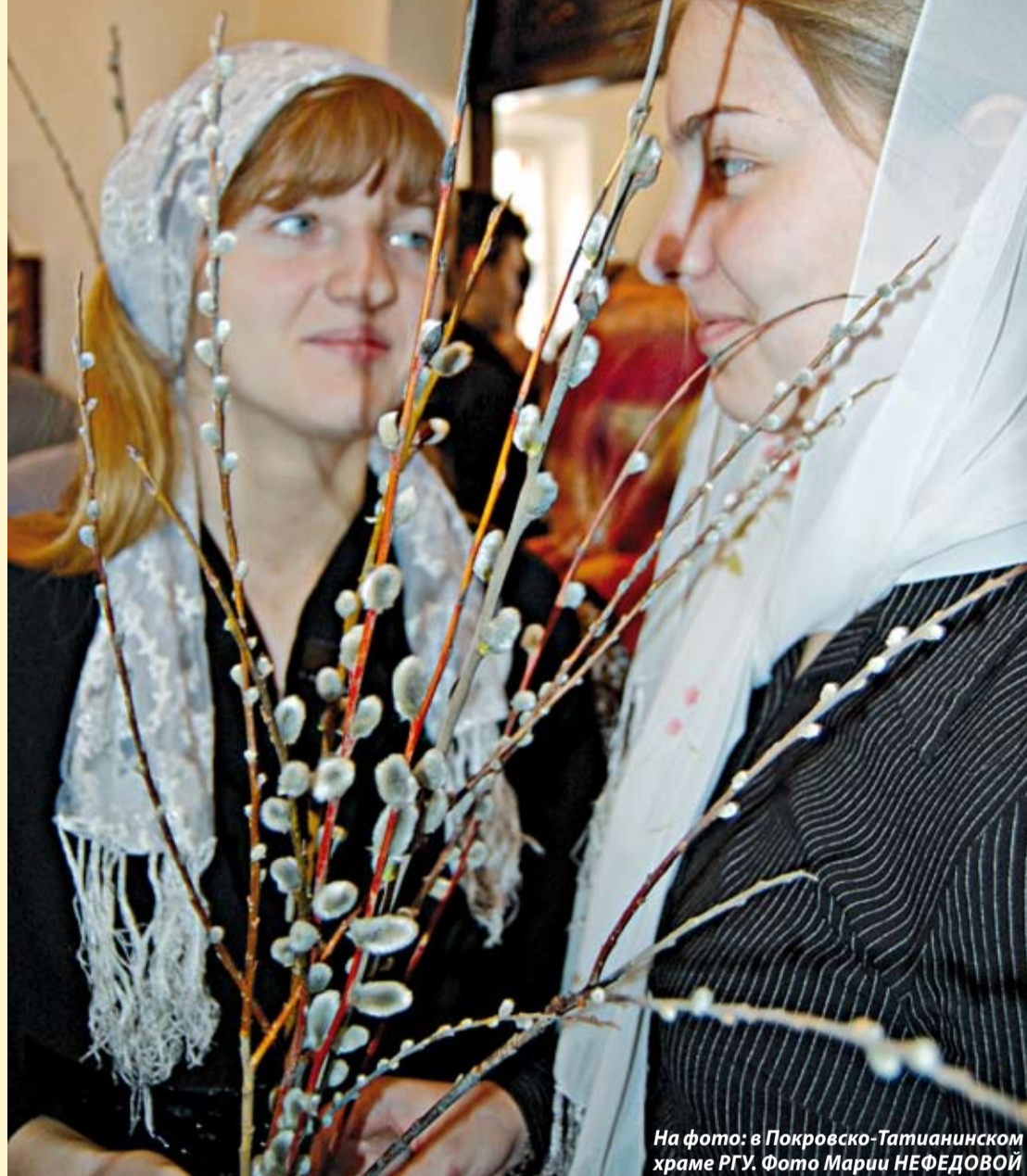
На фото: в Покровско-Татианинском храме РГУ.

Какова была цель торжественного входа Господа в Иерусалим? Почему Ему понадобилось ехать на осле? И при чем здесь вербы?