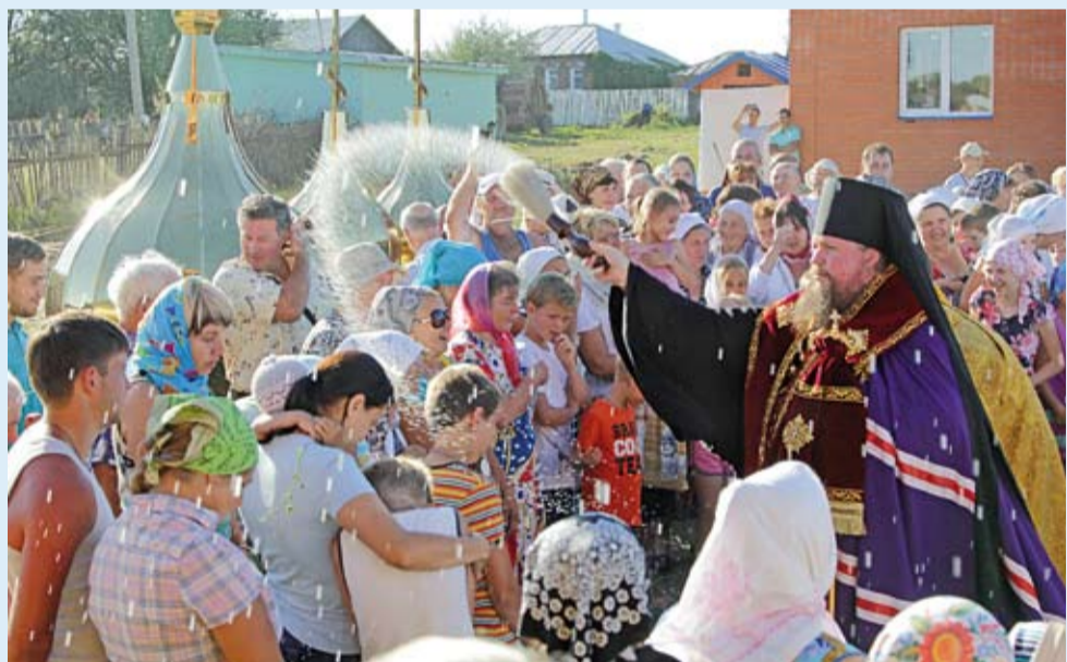
Освящение куполов в Троицком храме села Нармушадь. Август, 2015 г.

– Строительство храма в честь блаженной Матроны Анемнясевской – инициатива местного духовенства.