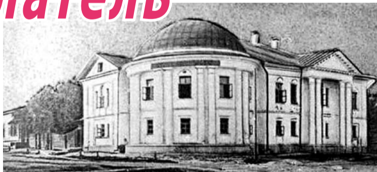
Мальшинская богадельня (с дореволюционной открытки)