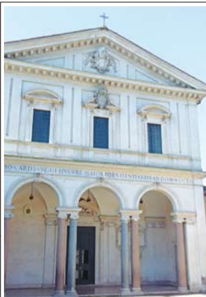
Базилика Святого Себастьяна.

браться до нее, современному туристу непросто: и транспортная сеть хромает, и Рим с его многочисленными музеями, храмами и эпичными развалинами всегда готов предложить десятки альтернативных пунктов назначения. И все же я очень рада, что мы прошли километров пять по древней Аппиевой дороге. Там нет ни толп туристов, ни киосков с магнитиками, а есть старинные мавзолеи, редкие виллы и много-много птиц, поющих на все лады, – даже попугаев! Но в целом это «просто дорога», как пишут в отзывах на туристических сайтах придирчивые пользователи. Ты долго идешь мимо полей, кипарисов, кактусов, древних могил и питьевых фонтанов по очень старым, не самым удобным камням... Но мне кажется, что трудно найти другое место в мире, где так остро вспоминается и переживается тот самый момент из жития святого Петра. «Куда идешь, Господи?»