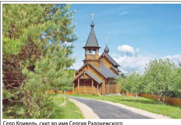
Село Кривель, скит во имя Сергия Радонежского

– После этого зашел я как-то в Николо-Ямской храм, прошел вовнутрь... и замер у одной иконы. На ней и был изображен тот самый батюшка, только образ его немного отличался по типу изображенного лица. У батюшки, встреченного мной на дороге, черты лица были более русские, славянские, а на иконе как-то скулы шире. По надписи я узнал, что это образ Сергия Радонежского. А вот и та самая фара –