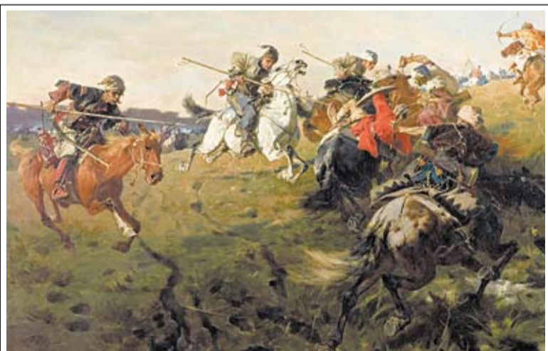
«Схватка казаков с татарами» (фрагмент). Художник Ю. Брандт

В течение многих столетий казаки защищали границы Отечества от внешних врагов. Первые казаки, по мнению многих исследователей, впервые появились на Рязанщине. Они защищали границы Рязанского княжества, граничащего со степью, да и всех русских земель от набегов кочевников со стороны Дикого поля. Известнейший российский историк XIX века С.М. Соловьев установил, что первое упоминание о казаках на Руси относится к середине первой половины XV века, когда в летописи «Повесть о Мустафе-царевиче» упоминаются казаки рязанские, «которые пришли на помощь к рязанцам и москвичам против татарского царевича Мустафы» в конце 1444 года. Это было знаменитое сражение на реке Листани (современное название – река Листвянка), когда татары потерпели тяжелое поражение.