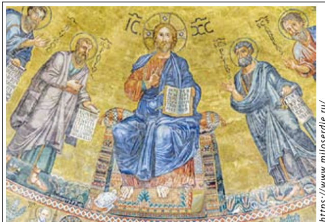
Христос с предстоящими апостолами. Петр и Павел. Деталь мозаичного купола. Базилика Святого Павла, Рим

кольцо. Оно приехало сюда из Палестины и считается верхней частью колодца, возле которого Господь Иисус Христос беседовал с самаритянкой.