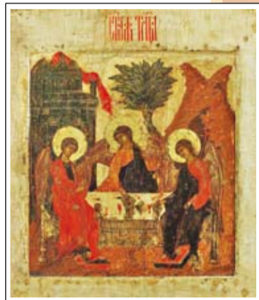
Икона Святой Троицы

Мы жили в небольшом деревянном доме, где в одной из комнат храни-