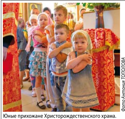
Юные прихожане Христорожественного храма.

Конечно, помогать приходят много людей, но вот с финансами дело обстоит гораздо сложнее, как бы работа сейчас ни продвигалась. Очень хочется, чтобы мечта прихожан и настоятеля наконец исполнилась.