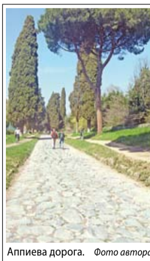
Аппиева дорога.