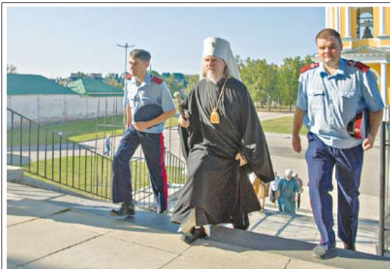
Представители Рязанского казачества сопровождают владыку Марка на службу.

Закон «О реабилитации репрессированных народов» был принят в России в 1991 году. Среди реабилитированных было упоминание и о казаках. А в порядке реализации этого закона