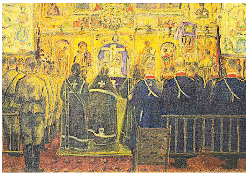
«Богослужение в Феодоровском соборе». 1916 г.

К 300-летию дома Романовых был подготовлен альбом «Феодоровский Государев Собор в Царском Селе». Над оформлением памятного альбома работал большой авторский коллектив, в который вошёл и Кирсанов. Шесть выполненных им картин с особым чувством передали царскосельскую атмосферу. Даже