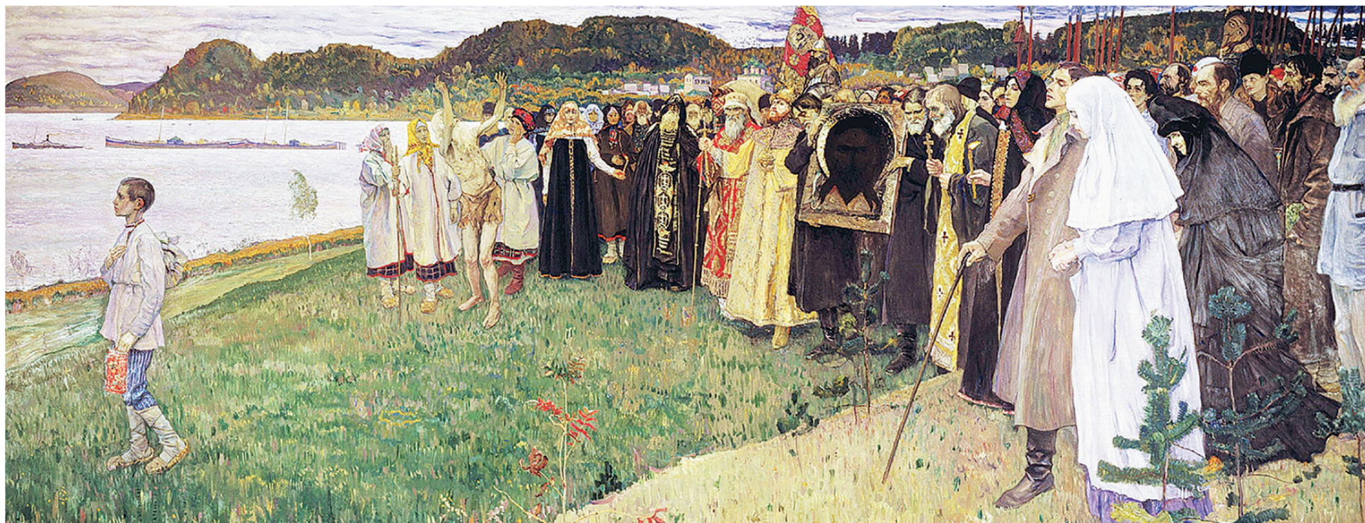
Нестеров М.В. «Душа народа»

Вместо покровительства, о котором писал старец Филофей, государство постепенно пыталось подчинить Церковь себе. Даже в противостоянии Алексея Михайловича и патриарха Никона тот же отец Георгий Флоровский видит не попытку Церкви подчинить государство, не попытку Никона стать православным Папой, а напротив – «наступление империи». Окончательно этот процесс завершается при Петре I, когда вместо патриарха Церковь начинает управляться Святейшим Синодом и становится как бы духовным министерством, строго подчиненным императору.