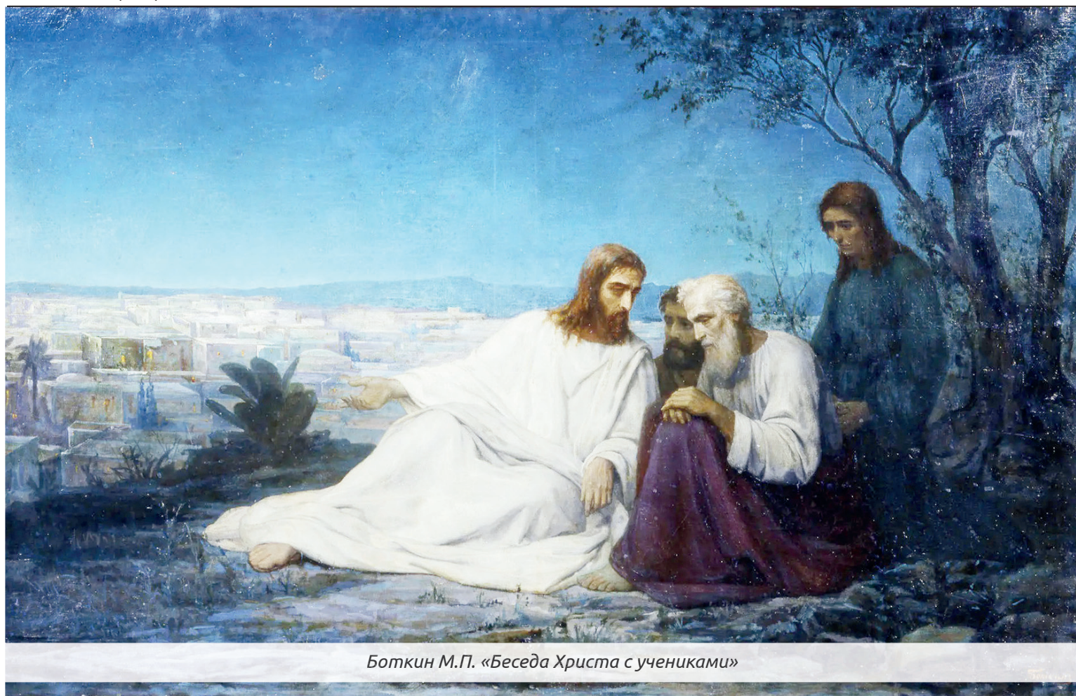
Боткин М.П. «Беседа Христа с учениками»

Египетской» (Иер. 32,20). И далее, следующий стих: «вывел народ Твой Израиля из земли Египетской знамениями и чудесами» (Иер. 32,21). Встречается данное выражение и у пророка Исаии. Правда, русский перевод дает совсем другие слова: «указания и предзнаменования» (Ис. 8,18).