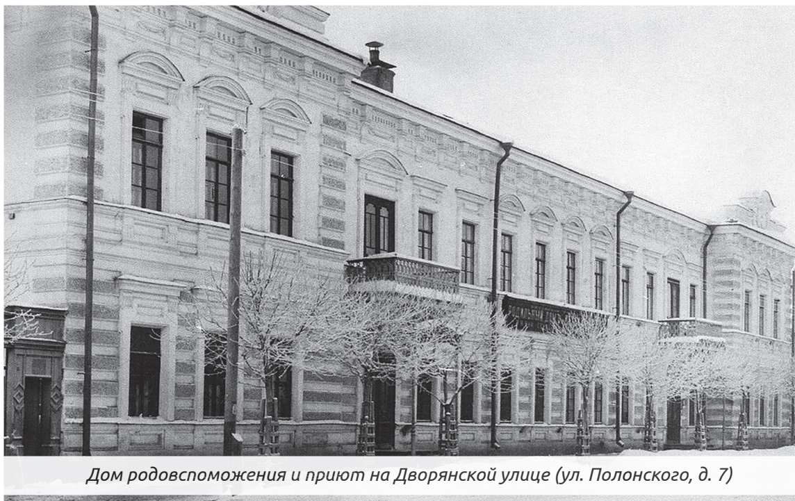
Дом родовспоможения и приют на Дворянской улице (ул. Полонского, д. 7)

... Кажется, какое отношение имеет благотворительность к немалой части населения нашей страны, далекой от серьезных капиталов? Но достаточно лишь немного обратиться вглубь себя и понять, на какие добрые дела мы способны (от «помочь старушке перейти дорогу» до «усыновить чужого ребенка» и т. д.), по силе творя дела добра, любви и милосердия, следуя простой библейской мудрости: «Уклонися от зла, и сотвори благо» (Пс. 33:15). И тогда культура благотворительности в широком понимании в полной мере станет органичной и созвучной всякому мыслящему человеку.